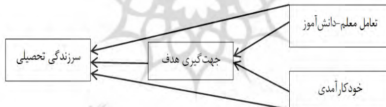
شکل ۱. مدل فرضی ارتباط متغیرهای پژوهش

در تبیین سرزندگی تحصیلی دانش‌آموزان، عوامل فردی اثرگذاری قوی‌تری دارند یا عوامل اجتماعی؟ دیگر مسئله قابل بررسی در پژوهش حاضر، نقش واسطه‌گری جهت‌گیری هدف است. اگرچه در پژوهش‌های مختلف، انواع جهت‌گیری هدف در نقش واسطه قرار گرفته‌اند اما نتایج در ارتباط با اهداف عملکردی و تسلطی متناقض بوده است؛ بنابراین با توجه به نقش انگیزشی جهت‌گیری هدف، به‌طور مشخص‌تر هدف پژوهش حاضر، آن بود که نقش واسطه‌گری انواع جهت‌گیری هدف را در رابطه بین تعامل معلم-دانش‌آموز و خودکارآمدی با سرزندگی تحصیلی بررسی نماید. نکته قابل توجه دیگر در پژوهش حاضر انتخاب درس و پایه تحصیلی دانش‌آموزان بود، از آنجایی که در دوره متوسطه اول دروس مختلف به معلم جداگانه‌ای مربوط می‌شود، لذا دو درس اجتماعی و علوم که با رشته‌های مختلف همپوشانی دارد، مورد بررسی قرار گرفت. مدنظر قرار گرفت. با نظر به توضیحات بیان‌شده درباره متغیرها و نقش عوامل محیطی، فردی، انگیزشی بر سرزندگی تحصیلی به‌عنوان پیشایندهای این سازه، پژوهش حاضر سعی دارد بررسی‌های انجام‌شده در این حیطه را توسعه داده و فهم بهتری از نقش عوامل ذکرشده جهت سرزندگی تحصیلی دانش‌آموزان ارائه دهد. شکل ۱ مدل مفهومی پژوهش حاضر را نشان می‌دهد.