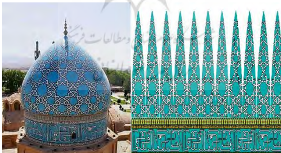
شکل (۲): بررسی نقوش و ابعاد گنبد مقبره شاه نعمت‌الله ولی