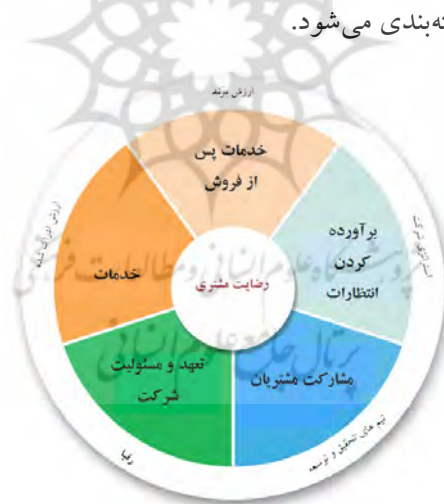
شکل ۱- علل موثر بر رضایت مشتریان ۵

رضایت، دارای مفهومی گسترده‌تر از کیفیت بوده و کیفیت جزو عوامل ایجاد رضایت در مشتریان به شمار می‌رود. رضایت عبارت است از ارزیابی مشتریان در مورد اینکه آیا محصول و خدمت توانسته است نیازها و انتظارات آنان را برآورده نماید یا خیر. در واقع رضایت مشتری ۱ ، پیامدی است که بر اثر ارضای نیازهای مشتری حاصل می‌شود و بیانگر نوعی قضاوت ذهنی در مورد محصول یا خدمت می‌باشد. نتیجه چنین رضایتی، ایجاد وفاداری در مشتریان، تکرار خرید و توصیه آن به دیگران جهت استفاده از محصولات و خدمات شرکت است. ۲ در تعریفی دیگر، «رضایتمندی مشتری جهت بازاریابی موفقیت‌آمیز، یک عامل قطعی به شمار می‌رود و به معنای درجه تناسب بین انتظارات مشتری در مورد یک خدمت (محصول) و عملکرد واقعی آن خدمت (محصول) می‌باشد. ۳ بر اساس یک دسته‌بندی جدید از علل موثر بر رضایت مشتری جانسون و همکاران ۴ به پنج بخش محتوایی و ۵ بخش ساختاری دسته‌بندی می‌شود.