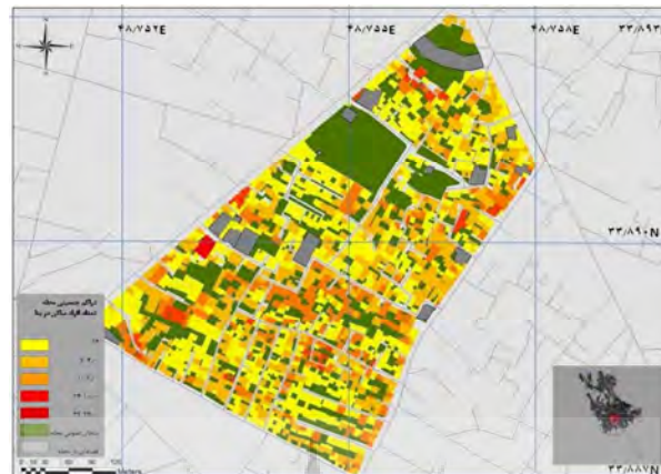
شکل ۷: جانمایی تراکم جمعیتی محله.

لازم به توضیح است که نقشه‌ها یا جداولی که بیانگر وجود استاندارد، وجود مدیریت و برنامه‌ریزی مقابله با بحران و رعایت حریم تأسیسات، در محله باشد (دو شاخص نخست در کلیه مقاطع چرخه و شاخص سوم بر آسیب پذیری در مقطع اضطراری اثرگذار است)، در محله قدغون موضوعیت نداشته و تنها در جدول ۱۰ و با توجه به پرسشنامه‌های مأخوذه از مطلعین و مسئولین، عدد آسیب پذیری هر کدام استخراج شده است.