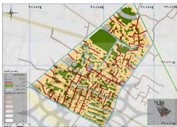
شکل ۴: آسیب‌پذیری لوله‌های گاز موجود در محله؛ منبع: نگارندگان.

نقشه آسیب‌پذیری دریچه‌های مخابرات: امروزه نیاز به تداوم ارتباط با سایر افراد و نقاط در مواقع وقوع بحران به منظور ایجاد ارزیابی دقیق از تلفات و خسارات سانحه و مشخص شدن میزان نیاز به امداد و نجات از اهمیت فراوان برخوردار است؛ از طرفی یکی از خسارات عمده وقوع زلزله در مناطق آسیب‌پذیر قطع خطوط ارتباطی می‌باشد؛ بنابراین این شاخص علاوه بر مقطع هنگام وقوع و اضطراری بر سرعت بازتوانی نیز اثرگذار است. مطابق با اطلاعات موجود در نقشه سه نوع دریچه در این منطقه وجود دارد، دریچه‌های از جنس آجر با ابعاد ۲*۲ که در سطح محلی سرویس‌دهی کرده و نیز آسیب‌پذیری بالایی دارند. دریچه‌های نوع دوم که در سطح بخشی از شهر خدمات‌رسانی می‌کنند از جنس بتن و دارای ابعاد ۳*۳ بوده و آسیب‌پذیری متوسطی دارند و در نهایت دریچه‌های بتنی شهری که ابعاد متغیر ولی بیش از ۴*۴ داشته و به دلیل نظارت مهندسی بر ساختشان آسیب‌پذیری بسیار پائینی دارند.