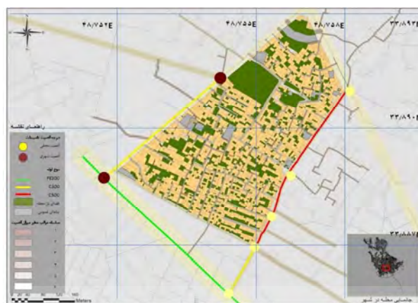
شکل ۱: آسیب پذیری تأسیسات فاضلاب در سطح محله: منبع: نگارندگان

نقشه جانمایی لوله‌های آب شهری در محله (دسته‌بندی شده بر اساس میزان آسیب پذیری): دسترسی به آب آشامیدنی بهداشتی یکی از نیازهای اولیه جامعه است که با وقوع زلزله در شهرها، تأمین این نیاز با مشکل مواجه می‌شود. وجود آسیب‌پذیری در این شاخص در مقاطع پس از وقوع بحران به ویژه مقطع اضطراری و ساماندهی اثرگذاری بالایی دارد.