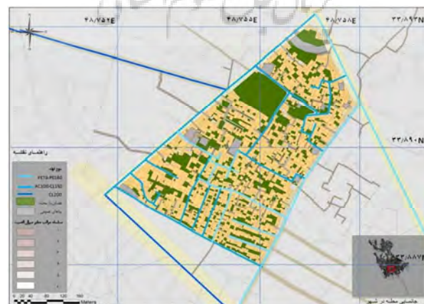
شکل ۲: آسیب‌پذیری لوله‌های آب شهری: منبع: نگارندگان