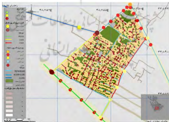
شکل ۶: آسیب‌پذیری بافت از ناحیه تأسیسات موجود در آن؛ منبع: نگارندگان.

این نقشه از روی هم قرارگیری وضعیت محله در شاخص‌های عینی وضعیت آسیب‌پذیری محله را از منظر شاخص‌های عینی تعیین‌کننده، نشان می‌دهد؛ که در آن رنگ‌های گرم به‌ویژه رنگ قرمز نشان‌دهنده آسیب‌پذیری بسیار بالا و بالا در تأسیسات بوده و رنگ‌های سرد (رنگ سبز و آبی) بیانگر آسیب‌پذیری کم تأسیساتی است.