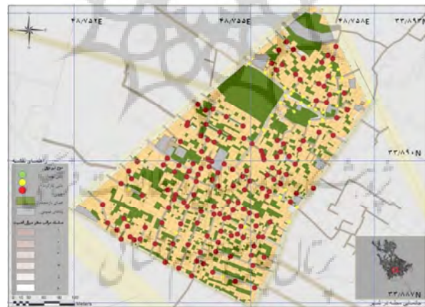
شکل ۳: آسیب‌پذیری تیرهای برق بافت؛ منبع: نگارندگان.

نقشه جانمایی لوله‌های گاز در سطح محله (دسته‌بندی شده بر اساس میزان آسیب‌پذیری): سوخت‌رسانی به شهرها به‌ویژه در مناطق سردسیر و کوهستانی اثرات ثانویه وقوع زلزله را کاهش خواهد داد؛ این شاخص به دو روش بر آسیب‌پذیری شهری اثرگذار است، نخست آسیب‌پذیری سامانه گازرسانی که خدمات‌رسانی را در بازه اضطراری و ساماندهی مختل می‌کند و دوم که اهمیت بیشتری نیز دارد، آسیب‌زایی سیستم و احتمال وقوع انفجار و آتش‌سوزی بلافاصله پس از وقوع زلزله لوله‌های گاز موجود در محله به دو گروه پلی‌اتیلن و فلزی تقسیم شده است.