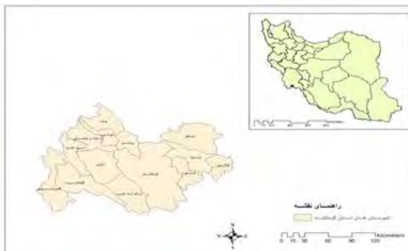
شکل شماره ۱. موقعیت جغرافیایی شهرستان‌ها در استان کرمانشاه و کشور