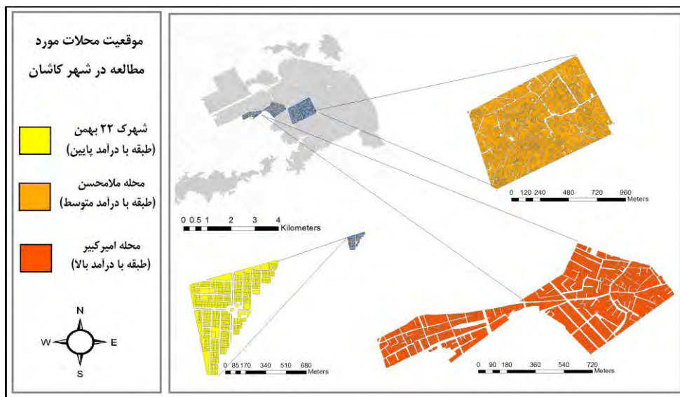
شکل شماره ۱. نقشه موقعیت محلات مورد مطالعه بر اساس پایگاه اقتصادی