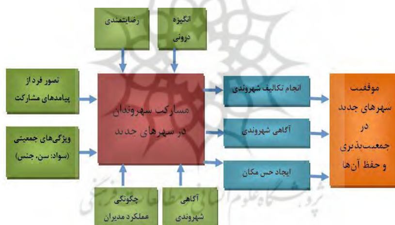
شکل شماره ۱. مدل مفهومی مشارکت شهروندی

نتایج مطالعه و بررسی تئوری‌ها و تحقیقات درباره مشارکت نشان داده است که عوامل زیادی در مشارکت شهروندی مؤثرند که هر یک به‌نوعی در افزایش و کاهش آن سهمی دارد. در صورتی که این عوامل به‌صورت مثبت عمل کنند باعث به وجود آمدن دستاوردهایی می‌شود که در نهایت منجر به بهبود افزایش مشارکت و بهبود عملکرد و پاسخگویی مدیران شهری خواهد شد. نتایج مطالعات و تحقیقات انجام شده توسط محقق، مدل نظری این پژوهش (شکل شماره ۱) را به وجود آورده است.