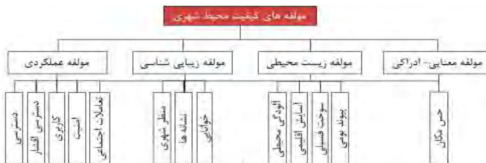
شکل ۱. مدل مفهومی سنجش کیفیت محیط شهری در این پژوهش، مأخذ: (یافته‌های پژوهش، ۱۳۹۵)

با توجه به شاخص‌های مطرح توسط صاحب-نظران، عوامل ایجاد کننده کیفیت محیط شهری را می‌توان در چهار مؤلفه اصلی عملکردی، تجربی-زیبایی‌شناسی، زیست‌محیطی و معنایی و ادراکی