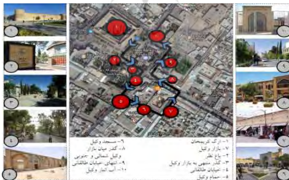
شکل ۲. معرفی محدوده مورد مطالعه

وکیل، آب انبار، میدان توپخانه و عمارت دیوانخانه همواره به عنوان نشانه‌های شهری شیراز و کاربری-های جاذب جمعیت معرفی و شناخته شده‌اند. تأثیر این بناها در شهر به گونه‌ای است که مراسم‌های ملی و مناسبتی بسیاری در فضای باز مجموعه یعنی میدان توپخانه برگزار می‌گردند. در بررسی کیفیت‌های معنایی، این مجموعه از جمله مکان‌هایی است که بار حیات ذهنی-خاطره‌ای شهر را به دوش می‌کشد. به طور کلی مرکز تاریخی زندیه پتانسیل تجلی حیات جمعی را دارد. در شکل ۲ محدوده مورد مطالعه نمایش داده شده است.