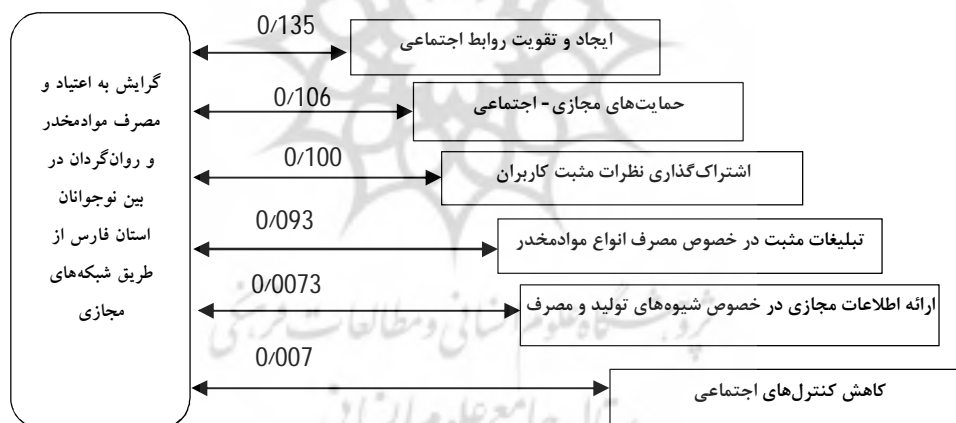
شکل شماره (2). مدل نهایی پژوهش.

در خصوص بررسی نقش مؤلفه‌های جمعیت‌شناختی در میزان گرایش به اعتیاد و یا همان اعتیادپذیری نوجوانان نیز برابر آزمون تی دو نمونه انجام شده، چون میزان سطح معنی‌داری به دست آمده برای تمام ابعاد جمعیت‌شناختی بزرگ‌تر از میزان سطح خطا (0/5) می‌باشد، بنابراین نوع جنسیت، سن، مقطع تحصیلی، میزان درآمد، شغل پدر و مادر و تحصیلات پدر و مادر بر سطح گرایش به اعتیاد و یا اعتیادپذیری نوجوانان تأثیری نگذاشته است؛ بنابراین با توجه به نتایج به دست آمده مدل نهایی پژوهش به شرح زیر قابل ارائه می‌باشد.