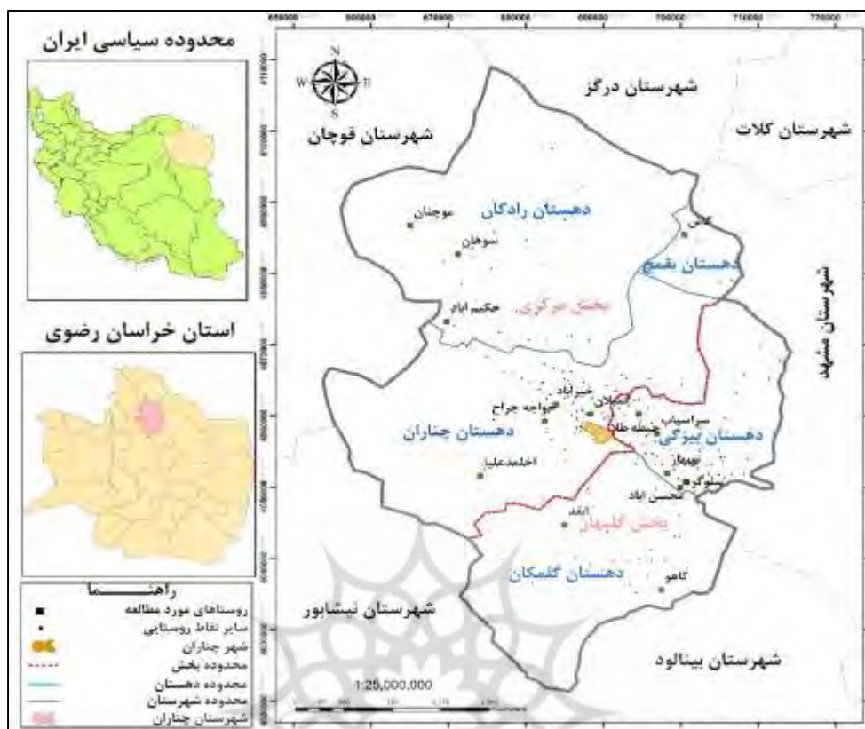
شکل ۱- توزیع فضایی روستاهای مورد بررسی در شهرستان چناران.