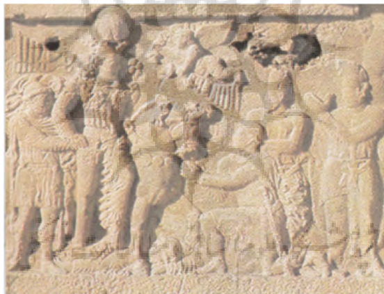
شکل شماره ۳: نقش برجسته شاپور اول در تنگ چوگان (Herman, 2008: 103)

آبیاری، تأسیس شهرهای جدید و کوچاندن اجباری جمعیت‌های بزرگ برای اسکان دوباره آنها در مناطقی که برای سرمایه‌گذاری‌های کشاورزی مشخص شده بود، از ویژگی‌های آشکار سیاست‌های شاهان ساسانی بوده است (Wilkinson, 2003: 92). تا ایران‌شهر از نظر اقتصادی و فرهنگی غنی شود و قادر باشد در برابر تهدیدات و حملات دشمنان ایستادگی کند. با این حال وی در تلاش بود تا برای اتحاد مرکز ایران شهر و مناطق پیرامونی ایدئولوژی مناسبی ارائه دهد و دوران او در این زمینه دوران آزمون و خطا می‌باشد؛ چرا که شاپور اول با توجه به کارنامه اعمال حکومتی‌اش چون پذیرش دین مانوی، ساخت معبد آناهیتا در بیشاپور و انجام کارهای عمرانی بسیار برای گروه اجتماعی مغان، رفتاری تسامح‌گرایانه داشت (Khosravi, 2014b: 212). از این رو اتحاد دین و دولت در زمان اردشیر اول و شاپور اول به بار نشست و فرآیند تمرکزگرایی تدریجی بود.