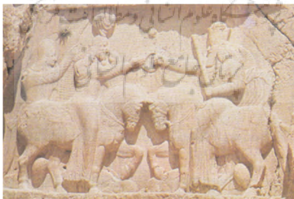
شکل شماره ۱: نقش تاج گیری اردشیر اول در نقش رستم (Herman, 2008:100)

یکی از آثار باستانی دوره وی نقش برجسته نقش رستم (شکل شماره ۱) است. در نقش برجسته اردشیر اول در نقش رستم، شاه و اهورامزدا در سطحی برابر قرار گرفته اند و هر دو سوار بر اسب هستند. اسب اهورامزدا پیکر اهریمن را و اسب شاه پیکر اردوان پنجم را لگدکوب می کند و در عین حال اردشیر، حلقه قدرت را از اهورامزدا دریافت می کند (Mousavi, 2008: 5).