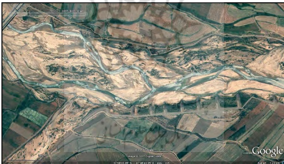
شکل (۲). فرم شریانی رودخانه قزل اوزن در ترانسکت شماره ۱۳

با توجه به جدول (۱) بیشتر مسیر رودخانه قزل اوزن در بازه مورد مطالعه از الگوی سینوسی تبعیت می کند به طوری که از ۲۴ ترانسکت، تعداد ۱۵ ترانسکت الگوی سینوسی دارد. البته در برخی از بخش های مسیر رودخانه، گرایش به الگوی مستقیم نیز دیده می شود که تعداد ۶ ترانسکت از این الگو تبعیت می کند. گرایش به الگوی مئاندری در این بازه از مسیر رودخانه کم و تنها در ۳ ترانسکت دیده می شوند. رودخانه قزل اوزن در بازه مورد مطالعه، به جهت مورفولوژی محیط اطراف مجرای رودخانه، وضعیت همگنی ندارد. در حالت کلی می توان ۲ تیپ شاخص را در این ارتباط مورد شناسایی قرار داد. تیپ اول فرم کوهستانی است که بیشتر مسیر رودخانه در این فرم جریان دارد. در این بخش ها، رودخانه غالباً در معبری تنگ و باریک طی مسیر می کند و یال های دامنه در سواحل راست و چپ رودخانه با شیب تند به مجرا ختم می شود. تیپ دوم، فرم دشت سیلابی است که بخش کمتری از رود در آن جاری است. در این مناطق به جهت پهن تر شدن مجرا، کاهش شیب دامنه ها و وجود زمین های قابل کشت، سواحل اطراف به زیر کشت رفته اند و مناطق مسکونی شکل گرفته اند. از نظر شکل ظاهری رودخانه قزل اوزن در این قسمت، حالت شریانی دارد؛ زیرا پتانسیل حمل رسوبات آن بالا بوده و برای اتلاف انرژی مازاد، جریان در آن تمایل به گستردگی دارد. از این رو تهنشست مواد رسوبی کف به میزان فراوان صورت می یابد شکل (۲).