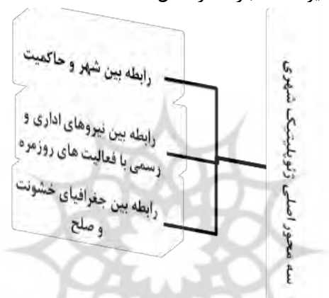
شکل (۳). سه محور اصلی ژئوپلیتیک شهری

به طور کلی، در خصوص رابطه میان ژئوپلیتیک و شهر و به طور ویژه در چارچوب ژئوپلیتیک شهری سه موضوع اصلی مورد توجه قرار می گیرند که عبارتند از شکل (۳):