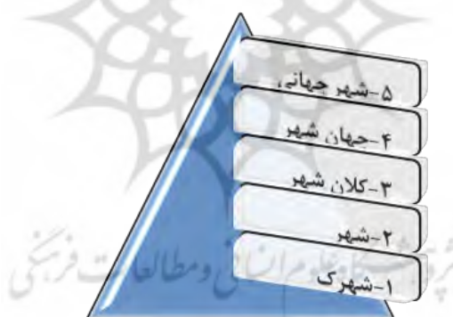
شکل (۱). انواع و مراحل تکامل شهر،