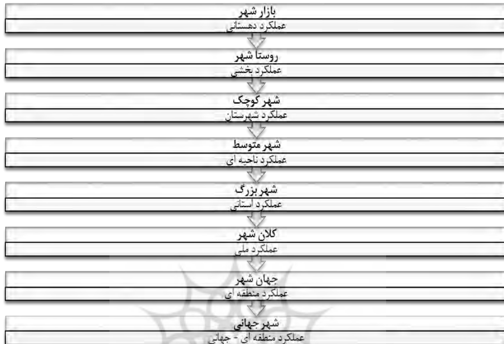
شکل (۲). انواع شهر از نظر اندازه و عملکرد فضایی

جغرافیدانان، شهر را محل تمرکز جمعیت، ابزار تولید، سرمایه، نیازها و احتیاجات و غیره می دانند که تقسیم کار اجتماعی نیز در آنجا صورت گرفته است و شهر را منظره‌ای مصنوعی از خیابانها، ساختمانها، دستگاهها و بناهایی می دانند که زندگی را امکان پذیر می‌سازد. بنابراین، شهر ترکیبی از عناصر مادی (مدنیت) و غیر مادی (اخلاقی) است که بخش دوم مهمتر است. (ربانی، ۱۳۸۷: ۱-۳).