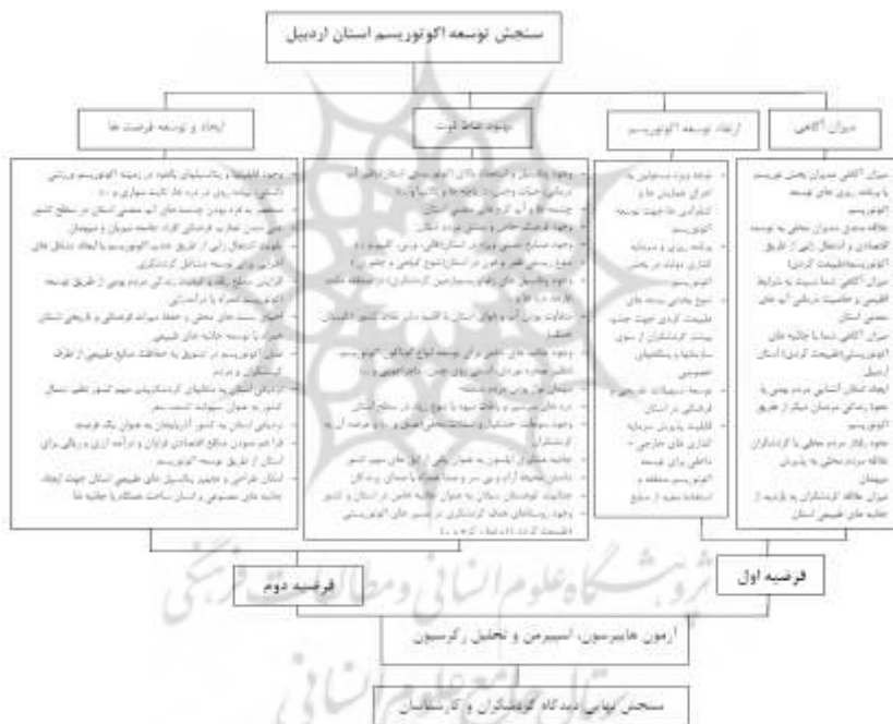
شکل ۱- مدل مفهومی تحقیق