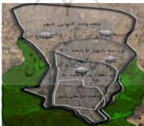
شکل ۳- روند کاهش مساحت باغات

که این پژوهش بر حوزه مرکزی آن متمرکز است (مهندسین مشاور نقش جهان پارس، ۱۳۹۲، ص. ۲۷). شهر قزوین توسط باغ‌هایی در نواحی شرقی، غربی و جنوبی احاطه شده است. این باغ‌ها که قدمتشان به قرن‌های ۷ و ۸ هجری بازمی‌گردد، امروزه به واسطه گسترش محدوده شهری با مشکلات عدیده‌ای مواجهند. انگیزه‌های اقتصادی ناشی از تفاوت فاحش میان درآمد ناشی از باغداری و سایر کاربری‌ها موجب شده که همواره خطری جدی باغ‌های قزوین را تهدید کند (مهندسین مشاور شهر و برنامه، ۱۳۹۴، ص. ۱۸). شروع تخریب باغات با اجرای اصلاحات اراضی در دهه ۱۳۴۰ شمسی آغاز شد؛ اما عوامل متعدد دیگری از جمله بی‌توجهی مسئولان در تدوین مقررات و تأمین نیازهای باغداران، ایجاد اخلال در یکپارچگی باغ‌ها به واسطه ایجاد راه‌ها و تأسیسات زیر بنایی، درآمد کم باغداران و غیره آن را تشدید کرده است (مهندسین مشاور شهر و برنامه، ۱۳۹۴، ص. ۱۹). در طی سالیان اخیر باغات روند تخریبی شدید داشته‌اند چنان که مساحت باغ‌ها از سال ۱۳۳۳ تا به امروز حدود ۳۳ درصد روند تخریبی داشته است (مهندسین مشاور شهر و برنامه، ۱۳۹۴، ص. ۲۰). شکل ۳ تغییر مساحت این باغات را از سال ۱۳۳۲ تا به امروز نشان می‌دهد در این تصویر بافت تاریخی شهر مشخص شده است که تا حدود ۶۰ سال پیش دورتادور آن را باغات فرا گرفته بودند. در پی توسعه بی‌رویه شهر این باغات تخریب شده و طی چند دهه به صورت کنونی باقی مانده‌اند.