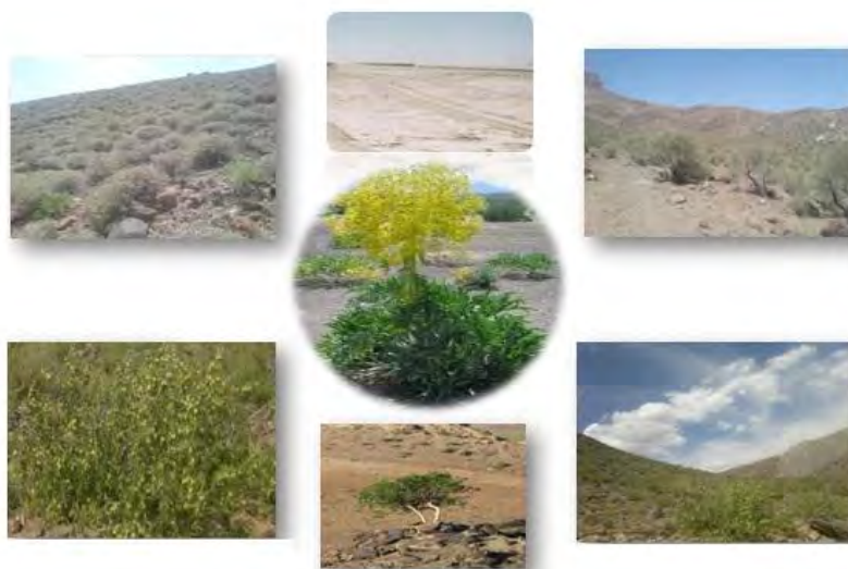
شکل ۲: برخی تیپ‌های گیاهی مراتع مورد مطالعه