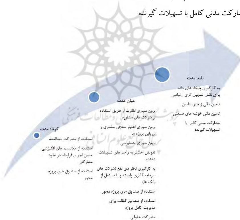
شکل ۲. تقسیم‌بندی زمانی راهکارهای گسترش تأمین مالی مشارکتی