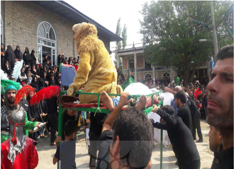
گروه کفن پوشان در حسینیه اعظم روستای جامخانه روز عاشورا