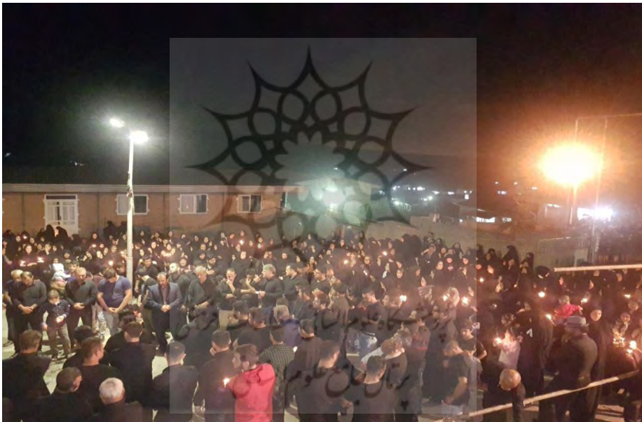
مراسم شام غریبان جامخانه

شام غریبان، مراسم مذهبی شیعه است که در غروب روز عاشورا برگزار می‌گردد. سوزاندن خیمه‌های اهل بیت حسین بن علی (ع) و به اسارت گرفتن اهل بیت توسط لشکر یزید بن معاویه درون ماهیه این مراسم است. در این مراسم عزاداران با روشن کردن شمع به عزاداری می‌پردازند. در مراسم شام غریبان در حرم علی بن موسی الرضا، همه خادمان حرم دور تا دور یکی از بزرگترین صحن‌ها شمع به دست می‌ایستند و یکی در وسط نوحه می‌خواند. مردم نیز همراه خادمان می‌شوند و شمع دست می‌گیرند. یک سینی بزرگ هم وسط صحن می‌گذارند که با شن پر شده و شمع‌های روشن را در آن فرومی‌کنند.