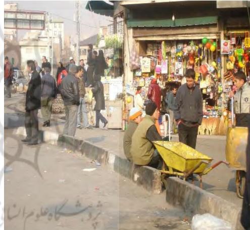
کناره‌های پیاده‌روها در میدان تجریش و عدم زیباسازی شهری

مشخصه معماری منطقه تحت تأثیر همان تفکرات رایج در معماری دوره قاجار بوده است، تفکراتی که در معرض نسیمی از فرهنگ غرب و واقع گشته بود و تظاهر اصلی آن عموماً در عناصر تزئینی و فرم‌های به کار رفته در نماها پدیدار گردید. روحیه معماری حاکم بر ساختمان‌های منطقه شمیران با همان مشخصات معماری شهر تهران با اندک تفاوتی در به‌کارگیری مصالح و روش‌های ساختمانی بوده است. به‌کارگیری بیشتر سقف‌های شیب دار و مصالح بدست آمده از محل (سنگ‌ها و قلوه‌سنگ‌های رودخانه‌ای) از آن جمله اند (اویسی: ۹۶)