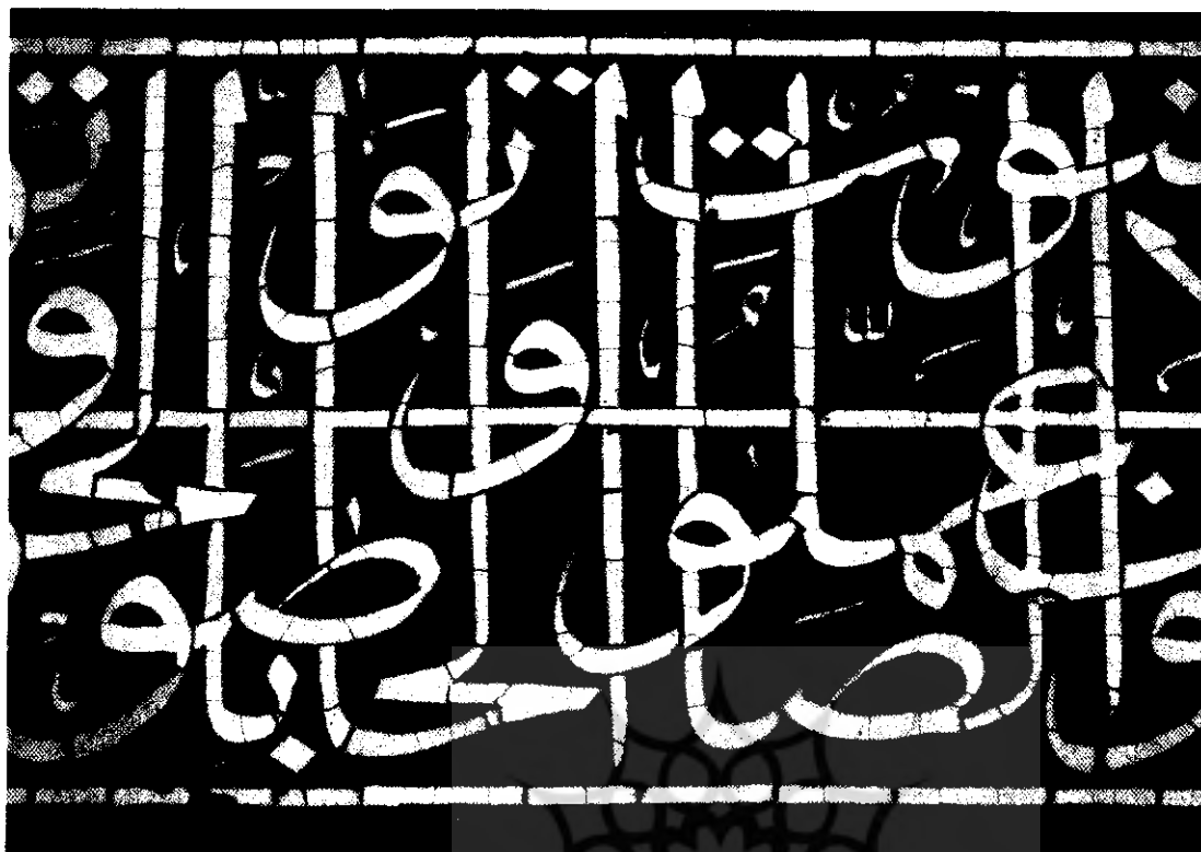
۴. کتیبه مسجد امام، اصفهان. دوره صفویه

حروف، مانند ص، ه، ط، که قبلاً سابقه داشته، فضاهای خارج از این نوع حروف، ما بین کلمات حروف و گردش نقوش را نیز به مقدار زیاد به ترتیبی رنگ آمیزی کرده اند که در مجموعه کتیبه نوعی هماهنگی و گردش رنگهای مختلف پدید آورده است. این امر نشان می دهد که هنرمند از رنگها و تأثیر آنها بر هم شناخت کافی داشته است. نکته شایان توجه این است که خط در سیطره رنگها در نیامده و اصالت و شخصیت آن کاملاً حفظ شده است. این کتیبه همانند نوعی نقاشی-خط، حاصل تلفیق و هم نشینی ملایم و مناسب طرح و نقش و خط و رنگ است.