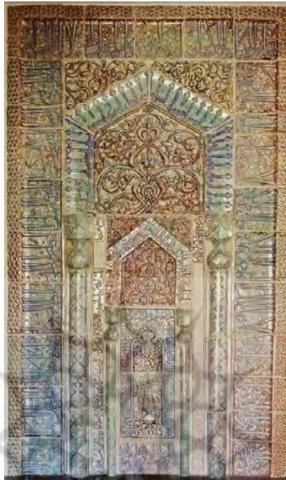
تصویر شماره ۱: محراب زرین فام امامزاده یحیی ورامین