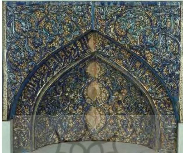
تصویر شماره ۸: محراب زرین فام بقعه عبدالصمد اصفهانی نطنز ( http://www.vam.ac.uk )

قسمت مرکزی این قطعه زرین فام که اسلیمی‌های برجسته و زیبایی در آن اجرا شده، با قوس‌هایی ملایم به طاق‌نما متصل می‌شود. دقیقاً در قسمت تیزه‌دار طاق‌نما و کمی مایل به چپ، لکه‌ای مشاهده می‌شود که در اثر رنگ پریدگی ایجاد شده است. در زیر این لکه و در قسمت مرکزی این قطعه از محراب، سه لکه رنگ پریده دیگر نیز به چشم می‌خورد که مرمت نشده‌اند و تا حد زیادی از زیبایی اثر کاسته‌اند. در این محراب از رنگ‌های آبی لاجوردی، سفید، سیاه و گاه آبی فیروزه‌ای استفاده شده است. همچنین آیاتی از سوره‌های مبارکه «اسراء»، و «رحمن»، بر کتیبه‌های این محراب جلوه‌گر شده‌اند.