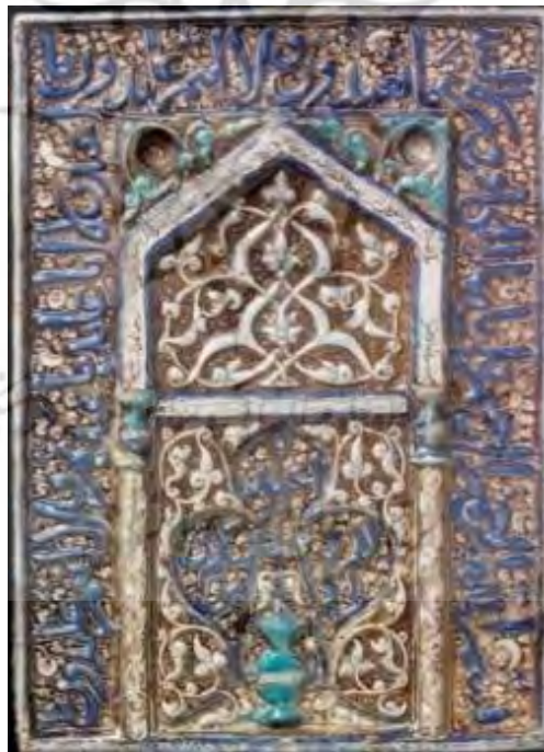
تصویر شماره ۷: محراب زرین‌فام کوچک، موزه ویکتوریا و آلبرت ( http://www.vam.ac.uk )

این محراب زرین‌فام که اندکی بزرگ‌تر از دیگر محراب کوچک موجود در موزه ویکتوریا و آلبرت خلق شده، ۶۳/۵ سانتی‌متر ارتفاع و ۴۶ سانتی‌متر عرض دارد. این محراب زرین‌فام نیز جزو دسته محراب‌های کوچک طبقه‌بندی می‌شود و هم‌اکنون در بخش هنرهای اسلامی و خاورمیانه‌ای موزه «ویکتوریا و آلبرت» لندن نگهداری می‌شود.