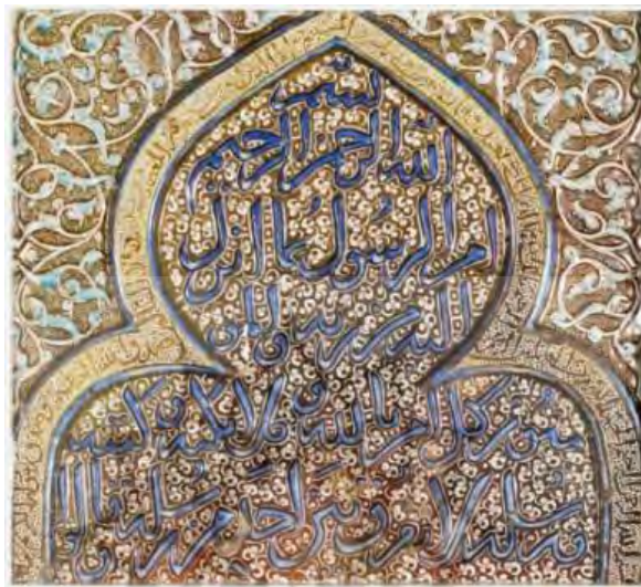
تصویر شماره ۲: محراب زرین‌فام متوسط موزه ویکتوریا و آلبرت

است. نقوش گیاهی مسطحی نیز در تمامی قسمت‌های محراب مشاهده می‌شوند. رنگ‌های آبی لاجوردی، قهوه‌ای، سفید، آبی فیروزه‌ای و سیاه در این قطعه زرین‌فام به کار رفته‌اند. وضعیت ظاهری این قطعه از محراب مطلوب بوده و در کتیبه‌های آن از سوره‌های مبارکه حمد و بقره استفاده شده است.