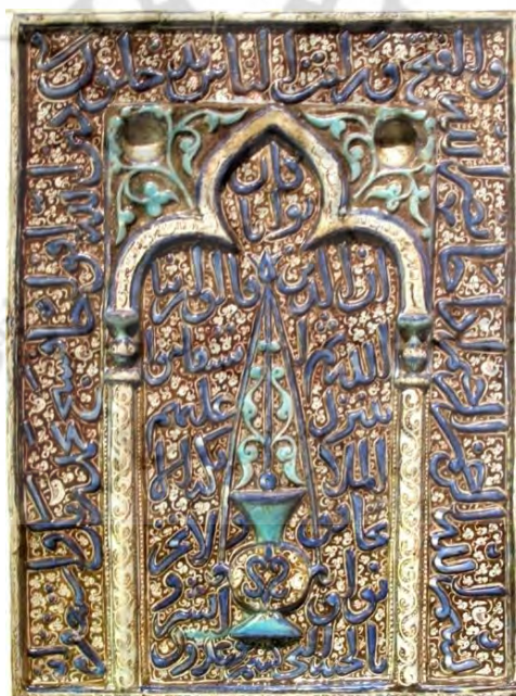
تصویر شماره ۱۱: محراب زرین‌فام موزه گلبنکیان