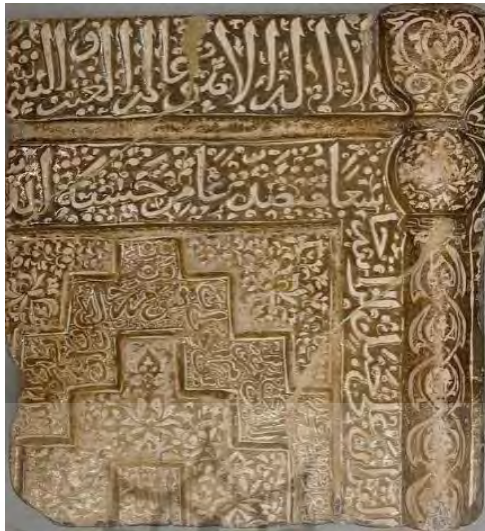
تصویر شماره ۱۳: محراب زرین‌فام موزه متروپولیتن ( http://www.metmuseum.org )