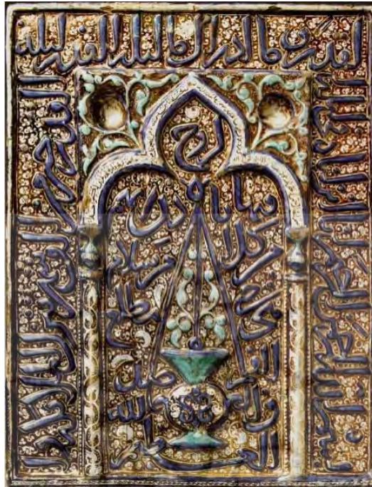
تصویر شماره ۱۲: محراب زرین‌فام موزه لوور ( http://www.Louvre.fr )

کار گرفته شده‌اند. وضع ظاهری این محراب نسبتاً مطلوب بوده و تنها مناطقی از آن دچار آسیب‌دیدگی جزئی شده است.