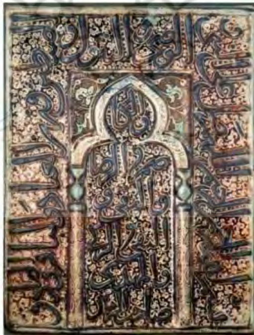
تصویر شماره ۴: محراب زرین‌فام موزة ملی ایران ( http://www.nmi.ichto.ir )

این محراب زرین‌فام کوچک تنها یک طاق‌نما دارد که در بالاترین نقطه خود، ناحیه‌ای تیزه‌دار ایجاد کرده است. این طاق‌نما نیز بر روی دو سرستون محراب واقع شده است. هریک از سرستون‌ها به نیم‌ستون‌هایی ختم می‌شوند که فاقد هرگونه پایه‌ستون هستند. در این محراب، کتیبه‌هایی اجرا شده که به صورت مسطح و برجسته، آیاتی از قرآن کریم را جلوه‌گر ساخته‌اند. در کتیبه‌های این محراب خطوط ثلث و نسخ به کار رفته و نقوش گیاهی که در آن خود نمایی می‌کنند، صرفاً به صورت مسطح خلق شده‌اند و در آن، رنگ‌های قهوه‌ای، آبی لاجوردی، آبی فیروزه‌ای و سفید به کار رفته است. وضع ظاهری این محراب کوچک نیز نسبتاً مطلوب است و تنها در برخی از قسمت‌های کتیبه‌ها، پاشیدگی رنگ و همچنین محوشدگی مشاهده می‌شود.