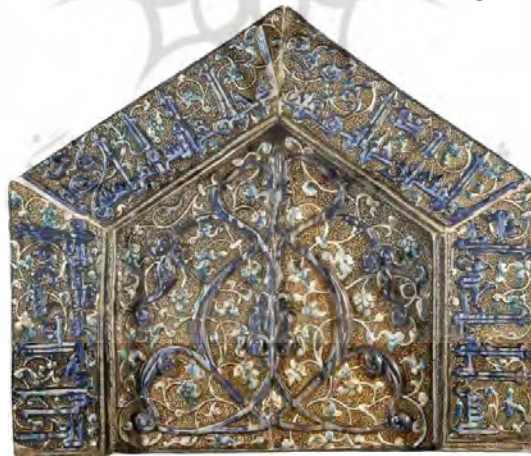
تصویر شماره ۱۰: محراب زرین‌فام موزه لاکما