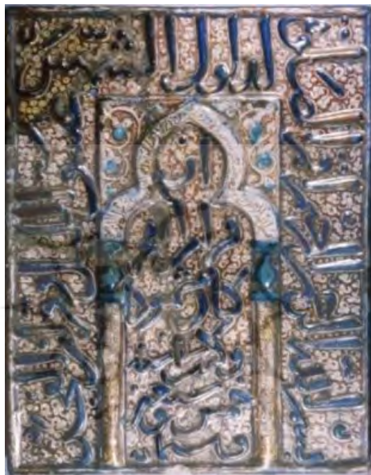
تصویر شماره ۳: محراب زرین‌فام کوچک موزه والترز

کوچک به چشم می‌خورند که به صورت مسطح و برجسته، آیاتی از قرآن کریم را نمایان ساخته‌اند. در کتیبه‌های این محراب از خطوط ثلث و نسخ استفاده شده است. نقوشی گیاهی به صورت برجسته و مسطح در این محراب به کار گرفته شده‌اند. این محراب زرین‌فام کوچک از لحاظ وضع ظاهری شرایطی نسبتاً مطلوب دارد و تنها در بعضی نقاط، محوشدگی کتیبه‌ها و آسیب‌دیدگی لعاب مشهود است.