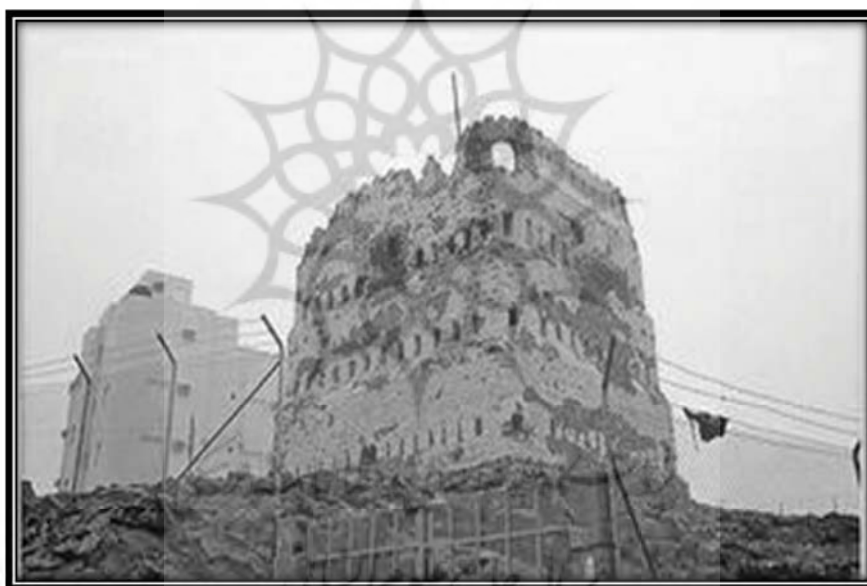
بازمانده قلعه‌های بنی‌نضیر در شهر مدینه