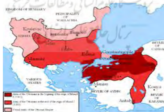
عثمانی در عهد مراد اول