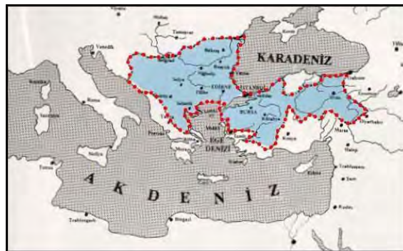
عثمانی در عصر بایزید اول