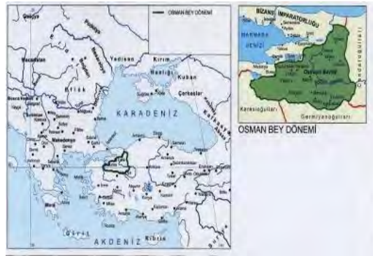
عثمانی در روزگار عثمان بیگ