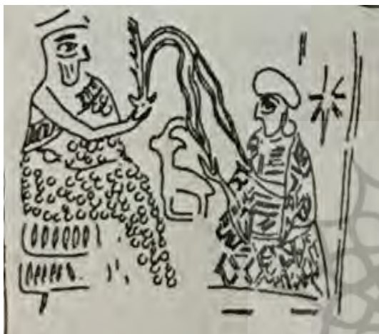
تصویر ایزد و شاه بر روی مهر (پاتس، ۱۳۹۱: ۲۴۲)

انکی/انا در دوره ایلام کهن به ایلام وارد شد و پیش این او از خدایان بیگانه بود؛ ولی پس از اندکی، در رده خدایان ایلامی پذیرفته و پرستیده شد و نمونه‌های متعددی از این ترکیب موفق اعتقادات میان‌رودانی و ایرانی را در حضور تندیس‌ها و نقوش گوناگون ترکیبی انسان‌ماهی و بزماهی می‌توان به‌خوبی مشاهده کرد (مجیدزاده، ۱۳۸۶: ۵۷؛ Hesari, 2014: 38).