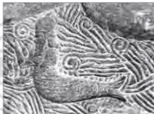
تصویر مردماهی از کاخ ساراگون II (Black & Green, 2004: 131; Hesari, 2014: 38)

شد. این موجود بیشتر در حکم چهارپای انکی مطرح بود؛ به این معنی که انکی یا روی آن می‌نشست یا همان گونه که نمونه‌اش دیده شده، خدای نشسته پاهای خود را روی بزماهی قرار می‌داد. این حیوان در نقش نوعی محافظ جادویی بود که به‌طور معمول با انسان‌ماهی همراه بود (پورفرسنگی، ۱۳۹۰: ۹۰). در آیین‌های پرستش آشوری چنین پیکره‌هایی پدیدار می‌شود. متون وابستگی او را با انا/انکی ثابت کرده‌اند. این پیکره نوعی محافظ جادویی بود که در نقوش بیشتر با انسان‌ماهی همراه است (Black & Green, 2008: 49).