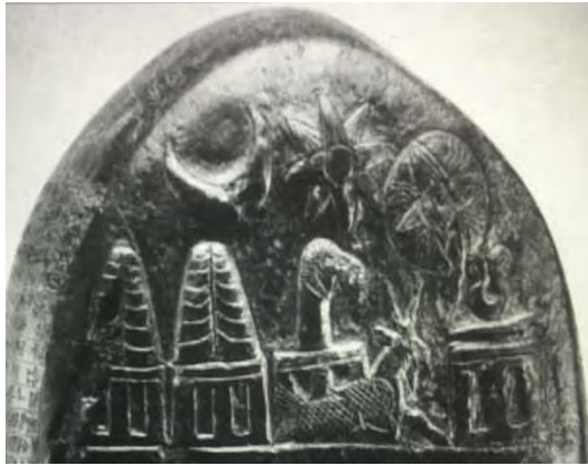
تصویر قسمت بالایی کودورو (Harper, 1992: 180)