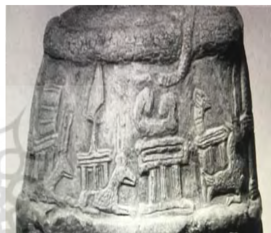
تصویر استل کودورو ۳۱ یافته‌شده از شوش (Harper, 1992: 180)

روی استلی که از اونتاش‌نایپیرشا باقی مانده است، نقش چهارپای انا به شکل گاو/مرد/وزرا انسان دیده می‌شود. وزراهای انسان‌نما از دوره پیش‌ایلامی (اوایل هزاره سوم ق.م) در حجاری‌ها نمود می‌یابد. پیکره گاو/مرد با سر و سینه انسانی و شاخ‌ها و پایین‌تنه و پاهای گاو/مرد شکل، نخستین بار در نیمه نخست سلسله آوان روی مهرهای استوانه‌ای دیده شد. او به‌طور معمول به‌صورت نیم‌رخ نشان داده شده است و یک شاخش به‌طرف جلو بیرون آمده است. البته در مواقع نادری تمام بالاتنه یا فقط سر به‌صورت تمام‌رخ دیده می‌شود. او به‌تنهایی یا دوتایی یا سه‌تایی در صحنه‌های نبرد دیده می‌شود و در حالی که روی دو پا ایستاده است، به‌طور حتم موجود دیگری در حال نبرد با او