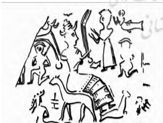
تصویر مُهری از شوش (پورفرسنگی، ۱۳۹۰: ۹۱)

از دوره ایلام میانه حوضی آئینی از جنس سنگ آهک وجود دارد که بزماهی‌هایی گرداگرد آن نقش شده‌اند (پورفرسنگی، ۱۳۹۰: ۹۰). چنانکه گفته شد این بزماهی‌ها حیوانات اِثا هستند که او بر آنها سوار می‌شود؛ از آنجا که آنها بر دیواره این حوضچه نقش شده‌اند و چون روی آنها آب حوض سوار است، این حوض استعاره از آپسو و محل زندگی اِثاست. همان طور که اشاره شد، حوض‌های معابد نیز آپسو خوانده می‌شدند و این حوض نمودی از همان اعتقاد را نشان می‌دهد. چنانکه روی کلاه‌خود نیز مشاهده کردیم ایزدبانوان دو طرف مردماهی دارای سُم‌های چهارپایان بودند و همراه شدن آنها با مردماهی شاید نمادی از این حیوان اِثا باشد. از آنجا که او نیز مانند مردماهی کلاه چندطبقه ایزدان را بر سر دارد، باید او را نیز از ایزدان و دارای نیرویی فراطبیعی دانست. روی مُهری اثری از یک الهه به چشم می‌خورد که الهه روی چهارپایی نشسته است و یک بزماهی زیر پای او قرار دارد.