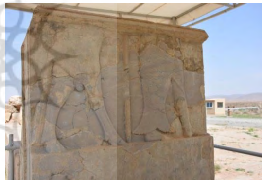
تصویر دو موجود در دو طرف دروازه کاخ بارعام در پاسارگاد

طبیعی به شمار می رفت و از آنجا که انا، خدای آب، ایزد خردمندی بود ماهی نیز نماد عقل و خرد محسوب می شد (پورفرسنگی، ۱۳۹۰: ۸۹). تندیس تنگ سروک را به احتمال باید به دوران نوایلامی مربوط دانست (Hesari, 2014: 39). در پاسارگاد نمونه ای از پاهای دو تندیس باقی مانده که در یکی از آنها فردی با پاهای انسانی نقش شده است که گویی بر یکی از پاهای خود پوششی از ماهی دارد و فرد دیگری با دو پای سم دار شبیه پای چهارپایان دیده می شود (Moradi, 2015: 253). این نقش نشان دهنده کاهنی مربوط به ایزد اناست که مطابق رسوم هزاره نخست ق.م، لباس او به شکل ماهی تزیین شده است (حیدری شکیب، ۱۳۹۱: ۶۰؛ گدار، ۱۳۷۷: ۱۱۱).