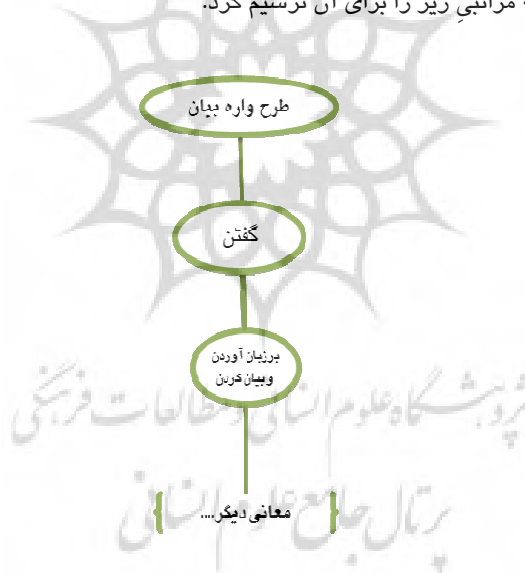
شکل ۳: رابطه سلسله مراتبی قالب اصلی «گفتن» در مفهوم «بر زبان آوردن و بیان کردن» (از بالا به پایین)

در جدول شماره ۷ پس از بیان «عنوان قالب معنایی»، بخش‌های «تعریف» و «عناصر اصلی و فرعی» به همراه مثال و با استناد به منابع این پژوهش، شمّ زبانی گویشور فارسی و از طریق بررسی قالب‌های معادل در فریمنت انگلیسی تکمیل شده‌اند. به علاوه، ۵۰ نمونه از افعال زیرشمول «گفتن» که دربردارنده مفهوم سرنمون این فعل هستند به عنوان «واحدهای واژگانی» انتخاب شده‌اند. همچنین، به دلیل محدود بودن پژوهش تنها پنج جمله در بخش «متون نشانه‌گذاری شده»، نشانه‌گذاری نحوی و معنایی شده‌اند. در نهایت، از تطابق قالب فوق با قالب‌های معادل در فریمنت انگلیسی، تنها یک رابطه میان‌قالبی به نام «وراثت» شناسایی شده است. این رابطه قوی‌ترین رابطه میان قالب‌هاست و در آن هر آنچه به لحاظ معناشناسی در مورد قالب والد حقیقت داشته باشد، با حقیقتی (هرچند خاص‌تر) در مورد قالب فرزند نیز تطابق دارد. بنابراین، به نظر می‌رسد می‌توان فعل «گفتن» را به عنوان فرزند «طرح‌واره بیان» در نظر گرفت و رابطه سلسله مراتبی زیر را برای آن ترسیم کرد.