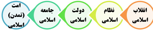
شکل ۱. مراحل ساخت تمدن اسلامی از دیدگاه مقام معظم رهبری

رهبر معظم انقلاب معتقدند که ما در مرحله سوم یعنی تشکیل دولت اسلامی و ساخت کشوری اسلامی هستیم، در همین رابطه ایشان می‌فرمایند: «ما در مرحله سومیم؛ ما هنوز به کشور اسلامی نرسیده‌ایم. هیچ‌کس نمی‌تواند ادعا کند که کشور ما اسلامی است. ما یک نظام اسلامی را طراحی و پایه‌ریزی کردیم و الان یک نظام اسلامی داریم که اصولش هم مشخص و مبنای حکومت در آنجا معلوم است. مشخص است که مسئولان چگونه باید باشند. قوای سه‌گانه وظایفشان معین است. وظایفی که دولت‌ها دارند، مشخص و معلوم است؛ اما نمی‌توانیم ادعا کنیم که ما یک دولت اسلامی هستیم؛ ما کم داریم. ما باید خودمان را بسازیم و پیش ببریم» (بیانات در دیدار کارگزاران نظام، ۱۳۷۹/۰۹/۱۲). اکنون مرحله تشکیل دولت اسلامی است و یکی از نقاط مهم و مؤثر شکل‌دادن به یک دولت اسلامی، داشتن کارآمدی لازم برای دولت بوده که سبب مشروعیت ثانویه کافی برای حکومت نیز می‌شود. این کارآمدی باید به‌صورت بومی‌شده در جهت رسیدن به اهداف کشور و سعادت ملت عمل نماید. اطلاع از سیاست‌ها و راهبردهای لازم جهت ارتقای کارآمدی نظام اسلامی به جامعه نخبگانی و مردم کمک می‌کند مطالبات دقیق‌تری داشته باشند و رسیدن به شایسته‌سالاری در انتخاب مدیران نیز به تحقق نزدیک شود.