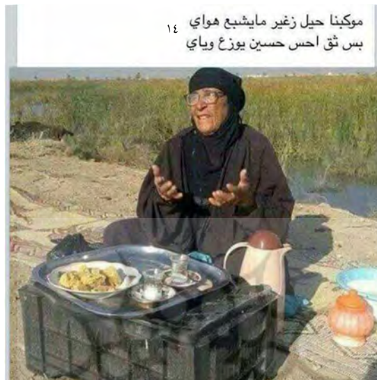
موکبنا حیل زغیر مایشیع هوای بس ثق احس حسین یوزع ویای ۱۴

موکب‌ها گاه خیلی کوچک و خاص هستند، مثل پیرزنی که با یک فلاکس کنار جاده نشسته و چای توزیع می‌کند و یا کودکی که با یک پارچ و لیوان آب توزیع می‌کند.