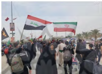
تصویر ۳: پرچم‌ها و نمادها ۱۶

نقاشی امام حسین (ع)، حضرت عباس (ع)، بدن تیرخورده و پاره پاره و خونین، مشک پاره، حضرت علی اصغر (ع) و اسراء در مسیر دیده می شود. زائران نیز نمادهایی با خود دارند از جمله سربندهایی که حاوی شعارهای حماسی یا توسل به ائمه (ع) می باشد؛ پرچم‌هایی با شعارهای یا حسین و یا مهدی و ... و یا پرچم کشورهایشان، و کوله نوشته‌هایی که آن‌ها نیز دارای مضامین مذهبی و حماسی هستند. برخی از زائران نیز عکس شهیدی را با خود حمل می کنند و نیت کرده اند که به نیابت از آن شهید پیاده به کربلا بروند.