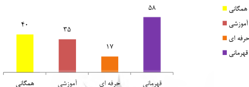
شکل ۱- نمودار ستونی توزیع فراوانی نمونه‌ها براساس میزان اثرهای واگذاری اماکن ورزشی بر ابعاد مختلف ورزش

بخش خصوصی قرار می گیرد، تنها به دنبال کسب درآمد بیشتر می باشند. به همین خاطر، افزایش یا کاهش ورزشکاران جامعه هدف برای بخش خصوصی فرقی ندارد.