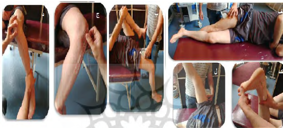
شکل ۲- حالت‌های اندازه‌گیری انعطاف‌پذیری: الف) آدکشن ران، ب) اکستنشن ران، ج) چرخش خارجی ران، د) چرخش داخلی ران، ک) انعطاف‌پذیری نعلی، ل) انعطاف‌پذیری فلکشن ران

دامنه‌های حرکتی در حالت پس‌پسوی اندازه‌گیری شدند. سه تکرار برای اندازه‌گیری انعطاف‌پذیری انجام شد. بین هر تکرار، ۳۰ ثانیه برای استراحت به آزمودنی‌ها وقت داده شد. پس از انجام تکرارها، میانگین سه تکرار برای واکاوی استفاده شد.