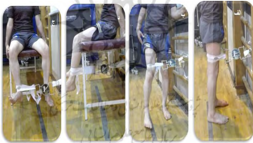
شکل ۱- حداکثر قدرت عضلانی برای گروه‌های عضلانی: الف) اکستنسورهای ران، ب) آبدکتورهای ران، ج) اکستنسورهای زانو، د) چرخاننده‌های خارجی ران

حداکثر انقباض عضلانی ایزومتریک (MVC) گروه‌های عضلانی آبدکتورهای ران، اکستنسورهای ران، اکستنسورهای زانو، فلکسورهای زانو، پلنتارفلکسورهای مچ پا، دورسی فلکسورهای مچ پا و چرخاننده‌های خارجی ران، به‌عنوان آزمون قدرت عضلانی اجرا شدند. قدرت عضلانی به‌وسیله یک دستگاه دینامومتر دستی ساخت کشور ژاپن با دقت اندازه‌گیری یک نیوتن اندازه‌گیری شد. یک طرف دینامومتر توسط باندی محکم به دیوار یا به جایی محکم ثابت شد و طرف دیگر دینامومتر توسط یک باند به اندام متصل شد. اندام‌ها در زاویه‌های مشخص (تصویر شماره ۱) توسط باندهایی قرار گرفتند تا با این کار خطای مداخله آزمونگر از بین رود. از آزمودنی‌ها خواسته شد که بیشترین نیرو را به باند وارد کند و حداکثر انقباض را به مدت پنج ثانیه برای هر گروه عضلانی انجام دهد (۲۰). این عمل سه تکرار انجام شد و بین هر تکرار ۳۰ ثانیه برای استراحت به آزمودنی‌ها وقت داده شد. پس از انجام تکرارها، میانگین سه تکرار برای واکاوی استفاده شد. سپس، قدرت هر گروه عضلانی به وزن آزمودنی‌ها نرمال شد.