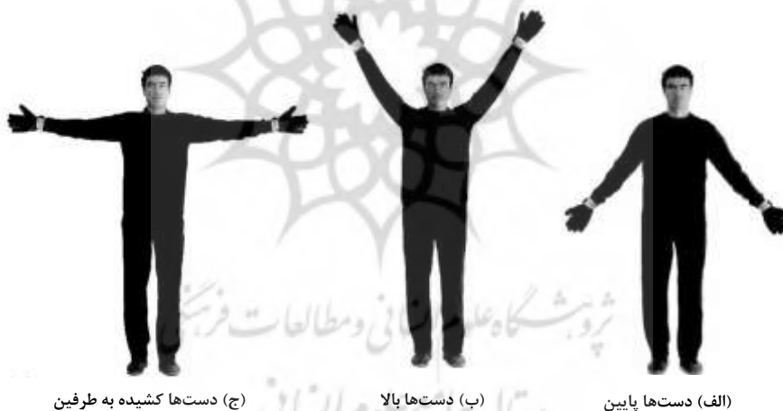
(ج) دست‌ها کشیده به طرفین

تصویرهایی از دروازه بان که وضعیت‌های قامت مشابه شکل‌های هندسی مولر-لایر اتخاذ کرده بود، تهیه شد. سه وضعیت قامت ایجاد شد: وضعیت قامت دست‌ها پایین، وضعیت قامت دست‌ها بالا، و وضعیت کشیده (کنترل) که دست‌ها در ارتفاع شانه از طرفین بدن کشیده شده بود. در موقعیت دست‌ها پایین، بازوها ۴۵ درجه زیر افق بود، در وضعیت دست‌ها بالا، بازوها ۴۵ درجه بالاتر از افق بود، و در وضعیت دست‌ها کشیده، بازوها در سطح افق نگاه داشته شده بود (به ترتیب شکل‌های ۲، الف، ب، ج). این شکل‌ها روی طلق شفاف با ابعاد کاغذ A4 چاپ شد. اندازه قد تصویر دروازه بان‌ها روی طلق‌های شفاف کاملاً مساوی بود.