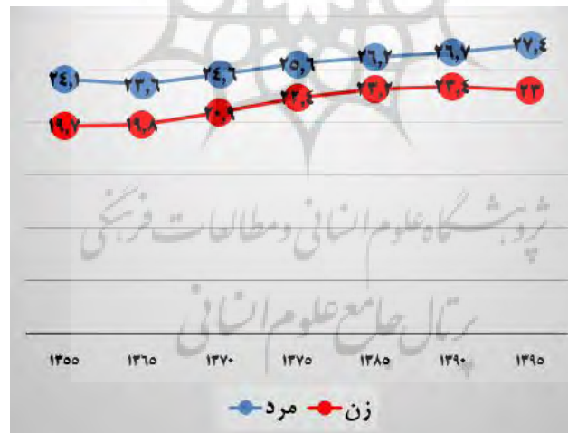
شکل (۱): میانگین سن افراد در اولین ازدواج برحسب جنس ۱۳۵۵-۱۳۹۵