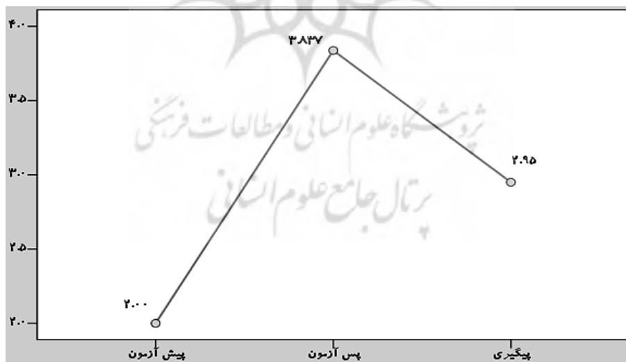
نمودار ۲. میانگین نمره انگیزش و علاقه‌مندی به مطالعه به‌روش کتاب‌خوانی در مراحل مختلف اجرا

در نمودار ۲، میانگین میزان انگیزش و علاقه‌مندی به مطالعه به‌روش کتاب‌خوانی در مراحل مختلف پیش‌آزمون، پس‌آزمون و پیگیری نمایش داده شده است.