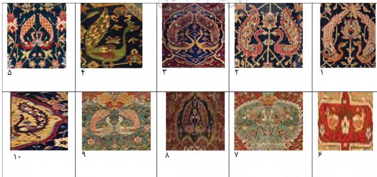
جدول ۲-نقشمایه طاووس در فرش های دوره صفویه - منابع تصاویر در جدول ۵

«نقش طاووس هم مثل نقش سیمرغ از جمله نقوشی است که در تزئینات مساجد و اماکن مذهبی در دوره‌های مختلف، از جمله صفویه حضور دارد، در تزئینات سردر ورودی بسیاری از مکان‌های مذهبی دوره صفویه از جمله مسجد امام اصفهان، حرم عباسی امام رضا(ع)، و ... می‌توان این نقش را مشاهده کرد، علت حضور این نقش، علاوه بر اینکه طاووس را یک مرغ بهشتی می‌دانند به عنوان دربان و راهنمای مردم به بهشت می‌باشد» (خزائی، ۱۳۸۰: ۱۴۰-۱۴۱). نقش طاووس در اکثر طرح‌های قالی‌های دستباف ایرانی به چشم می‌خورد «این پرندۀ بهشتی، در قالی‌های ایران- به ویژه قالی‌های محرابی- کاربرد بسیار دارد. این نقش اغلب به صورت دو طاووس با دم باز در دو طرف یک درخت یا گلدان در مرکز محراب یا یک طاووس در سر محراب (لچک) تصویر شده است که به نظر می‌رسد اشاره‌ای به بهشت برین و همچنین زندگی جاودانه پس از مرگ است» (خسروی فر و چیت سزایان، ۱۳۹۰: ۳۲).