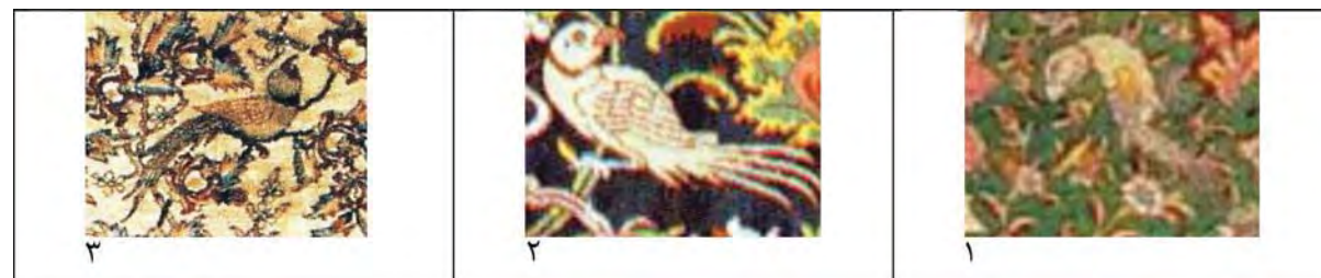
جدول ۴- نقشمایه طوطی در فرش‌های دوره صفویه - منابع تصاویر در جدول ۵

به گفته عطار «پرندگان هر کدام نماد و نماینده یکی از تیپ‌های اجتماعی هستند: طوطی، نماد خودخواهان است» (خسروی، ۱۳۸۷: ۷۶).