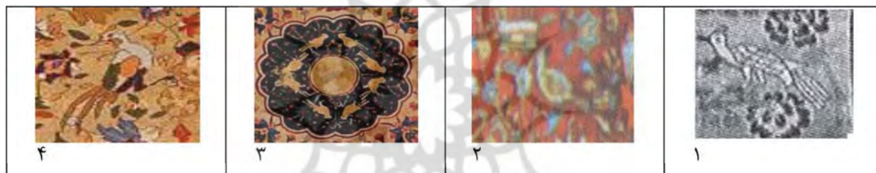
جدول ۳- نقشمایه هدهد در فرش‌های دوره صفویه - منابع تصاویر در جدول ۵

با توجه به مقام عرفانی هدهد و جایگاه نمادین او در هنر و ادبیات ایران، همواره هنر اسلامی از نقش نمادین هدهد در اکثر هنرها استفاده برده است. «در باورهای اسلامی، به کارگیری نقش این پرنده چه به صورت واقعی و چه انتزاعی در قالی‌هایی با طرح باغی، در قالبی نمادین، اشاره‌هایی به تصویر نمادین فردوس یا باغ بهشت در فرش ایران است» (خسروی فر و چیت‌سازبان، ۱۳۹۰: ۳۴). نقش هدهد در قالی‌های تصویری که داستان حضرت سلیمان را روایت می‌کنند، چشمگیر است (همان).