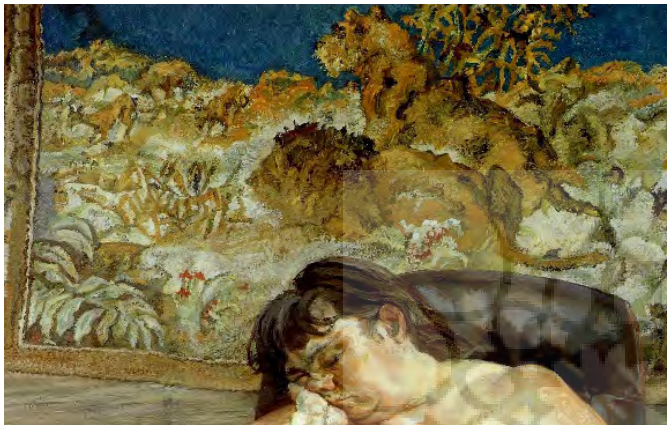
تصویر ۶: لوسین فروید، خوابیده کنار فرش شیر، دیتیل اثر، ۱۹۹۶

دو به شدت مورد تحسین فروید بوده اند. طبق تحلیل میشل لانگ، نمود واقعی نقاشی های فروید از دو نقاش به نام باروک تغذیه شده است. جدای از تشابه فیگورهای فربه و حجیم زنان در آثار فروید و روبنس، از شکل افتادگی گوشت و چربی و نمایش لایه های زیرین بدن، از رویکردهای مشترک این دو نقاش به بدن انسان است. «بدن های روبنس تمرکز و نگاه دقیق تری را از ما طلب می کنند زیرا پیچیدگی شان به طور ناخودآگاه، جستجوی بصری بیشتر و جذاب تری را از ما طلب می کنند (Perez, 2011: 68). این درهم تنیدگی فرم بدن و ارتباطش با نقاشی باروک مورد