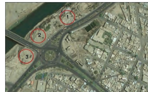
تصویر ۱۰. عکس هوایی از محله رودبند