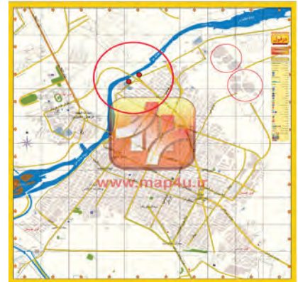
تصویر ۸. نقشه شهر دزفول

پراکنش جغرافیایی مزارهای آجری سنگ‌مزارهای قدیمی دزفول از لحاظ ساخت و نقش‌مایه‌های به‌کار برده‌شده، دارای ویژگی‌هایی ممتاز بوده و از سنت‌های رایج پیشین در ساخت سازه‌های آرامگاهی برخوردار است که به لحاظ نوع معماری پیوستگی کاملی با معماری خاص این بوم دارد. همان‌گونه که سنت معماری آجری در دزفول با ورود جلوه‌های مدرنیته به ایران دست‌خوش دگرگونی گردید و معماری نوین جایگزین هویت و اصالت سازه‌های بومی گردید، در مورد ساخت سازه‌های آرامگاهی نیز الگوهای گذشته در حال حاضر جای خود را به مصالح امروزی و متداول سنگ‌مزار داده است. با این وجود با توجه به تاریخ روی قبور مذکور پیداست تا نیمه دوم دهه ۵۰ خورشیدی (۱۳۵۰.ش.) تکنیک مورد بحث زنده و معماران این فن حضور داشته‌اند. در روند نوسازی شهر شماری از گورستان‌های قدیمی چون گورستان ابوالعلا، گورستان علی مالک و گورستان صائبین تخریب و تبدیل به قسمتی از فضای نوین شهری گردید. در این بین دو گورستان رودبند و کاشفیه در جوار رودخانه دز تا به امروز محفوظ مانده است. همچنین نمونه‌هایی از چنین الگوهایی از ساخت مزار در اطراف دزفول به ویژه بارگاه‌های آرامگاهی چون آرامگاه یعقوب لیث صفاری و محمد بن جعفر وجود دارد.