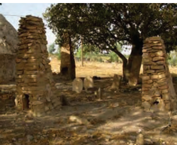
www.taknaz.ir. (تصاویر ۶ و ۷)