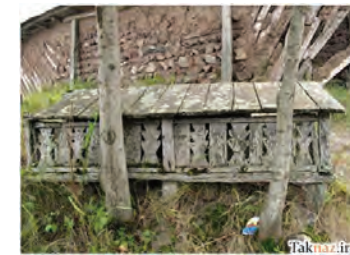
تصاویر ۳ و ۴. www.taknaz.ir

نقاشی مطرح می‌شود» (www.taknaz.ir). برای مثال نقش مسجد با ۲ مناره و گلدسته نشان از مسلمان و شیعه بودن شخص فوت شده دارد. همین طرح را در قبور آجری رودبند هم مشاهده می‌شود. (تصاویر ۱ و ۲)