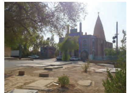
تصویر ۹. نمایی از مقبره رودبند

پیرامون پیر رودبند گورستانی قدیمی قرار گرفته است که به گورستان رودبند مشهور است. در فاصله‌ای نزدیک از سمت شرقی آرامستان رودبند، در امتداد رودخانه دز گورستان دیگری واقع است که محصور بوده و کاشفیه نام دارد. آرامگاه‌های قدیمی واقع در این دو مجموعه گویای سنت پیشین ساخت مقابر آجری در دزفول می‌باشد. مزارهای موجود در مجموعه‌های آرامگاهی رودبند و کاشفیه یک دست نبوده و برخی که متأخرترند دارای پوشش‌های سنگی و مرمرین امروزی هستند. (تصویر ۱۰)