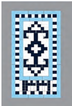
تصاویر ۱۱ و ۱۲. طراحی از نگارندگان