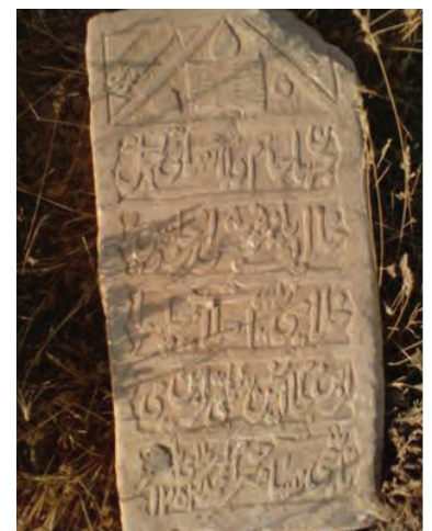
تصویر ۲. www.taknaz.ir