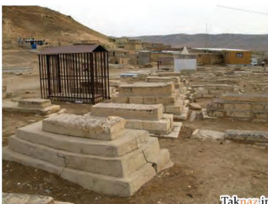
تصویر ۵.

در برخی نقاط کشور مقبره‌ها شکل و شمایل بسیار متفاوتی دارند. «سنگ قبرهایی برافراشته و به شکل مجسمه که برخی مورخان شکل و شمایل آن‌ها را مربوط به دوران چنگیزخان مغول و مرتبط با رسوم آن‌ها می‌دانند. به این مقبره‌ها اصطلاحاً «سنگ افراشته» می‌گویند. در استان گلستان، شهرستان کلالة و در نزدیکی زیارتگاه خالدنبی و همچنین در منطقه «باخرز» از توابع استان خراسان، قبرستان‌های متعددی در روستاها دیده می‌شوند که دارای سنگ افراشته هستند. در شهر تبریز و در حدود شش کیلومتری باغ «ایل‌گلی»، در روستایی که نامش «پینه‌شلوار» است، قبرستانی وجود دارد که چند قبر با سنگ افراشته بدون کتیبه و شبیه به آن‌چه در خالدنبی وجود دارد در آن دیده می‌شود. در استان لرستان نیز قبرستان‌های بسیاری در روستاها دیده می‌شوند که دارای سنگ افراشته هستند. نام یکی از این روستاها، «ابوالوفا» است که در نزدیکی «کوه‌دشت» واقع شده است. سنگ افراشته‌های این قبرستان چهار وجهی و هرمی شکل هستند و در هر وجه آن نوشته‌ها و نقوش بسیار زیبا و معناداری دیده می‌شوند. در نزدیکی مرز میان استان ایلام و کرمانشاه، شهری به نام «شاه‌بداغ» وجود دارد که جزو استان کرمانشاه محسوب می‌شود و در آن یک قبرستان با سنگ‌های افراشته وجود دارد، همچنین در استان کرمانشاه و در مسیر «ریجاب» به «بابا یادگار» قبرستانی هست با سنگ‌های افراشته‌ی چهار وجهی و در حدود دو متر که آجرچینی و سنگ‌چینی شده‌اند.» (www.taknaz.ir). (تصاویر ۶ و ۷)