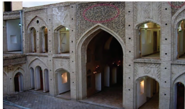
دیوار امامزاده رودبند