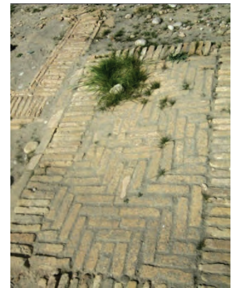
تصاویر ۲۷ تا ۳۲