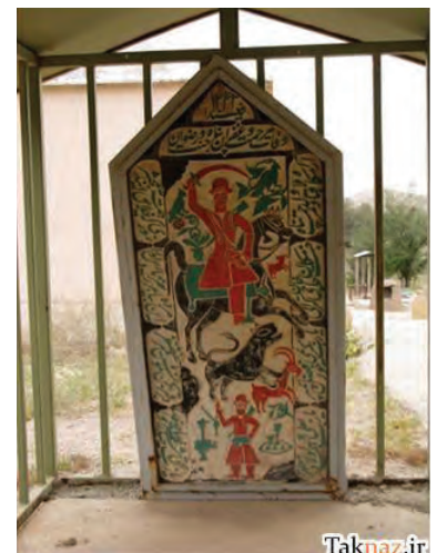
تصویر ۱.

در کشورمان گونه‌های مختلف سنگ قبر به غیر از سنگ قبرهای معمولی که به شکل سنگی هستند، وجود دارد. در بسیاری از شهرها و روستاهای ایران، با توجه به فرهنگ و تاریخ گذشته‌ی مردمانش، اشکال متفاوتی از سنگ قبر به چشم می‌خورد. «شاید خوش‌ذوق‌ترین قوم ایرانی در طراحی و ساخت مقبره، اقوام بختیاری و بخشی از مردم استان فارس و استان خوزستان باشند. مردم این مناطق سنگ قبر را با توجه به شخصیت و گذشته‌ی شخص متوفی نقاشی می‌کنند. در این نقاشی‌ها آداب و رسوم مردم، به صورت برخی اشکال خاص و به عنوان نمادهای بختیاری، بر روی مقبره ترسیم شده‌اند. مثلاً در فرهنگ بختیاری شیر نماد دلاوری و شجاعت را دارد، اسلحه نماد شکار و جنگاوری است و اسب سیاه به نشانه‌ی عزا و ماتم ترسیم می‌شود. در فرهنگ ایل بختیاری حتی دین و مذهب نیز به صورت