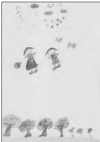
مجموعه تصاویر ۴: