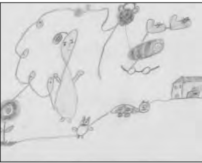
مجموعه تصاویر ۵:

کودک نقاش در تصویر ذکر شده، شاید ناخواسته از همین شیوه بهره برده است و با استفاده‌ی متفاوت از دفتر مشقی که تمام شده است و فقط با خودکاری که در اختیار داشته، نقاشی کرده است و اتفاقاً با بریدن بخشی از نقاشی که شبیه درخت شده است و چسباندن مجدد آن بر سطح