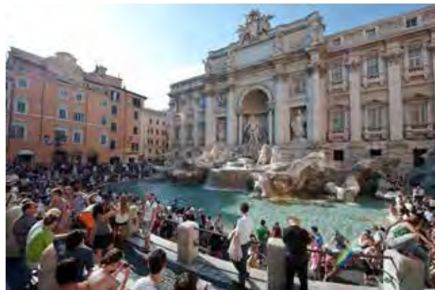
تصویر ۵. شکل‌گیری میدان تروی وابسته به وجود بزرگ‌ترین آب‌نمای رم در محل یکی از قنات‌های باستانی شهر.