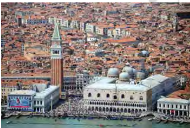
تصویر ۸. موقعیت مکانی و ارتباط بلافاصله میدان سن مارکو ونیز با دریای آدریاتیک.