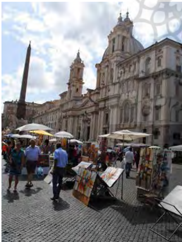
تصویر ۱۰. میدان ناوونا در شهر رم، حضور هنرمندان و فروشندگان خیابانی، از عوامل سرزندگی و پویایی میدان، مأخذ: آرشيو پژوهشکده نظر، ۱۳۹۴.

ناوونا، مشهورترین میدان تاریخی شهر رم، در محل سابق استادیومی باستانی ساخته شده است. این میدان که ابتدا محل برگزاری مسابقات اسب‌دوانی و ارابه‌رانی بوده، در گذر زمان تبدیل به بازار مرکزی شهر شده و امروزه یکی از موفق‌ترین فضاهای جمعی رم است. ساختمان‌های تاریخی و باشکوه اطراف میدان مانند کلیسای سنت آگنس و عناصر فیزیکی مانند ابلیسک، آب‌نماهای تاریخی و مشهور از هنرمندانی همچون «برنینی» و نیز مبلمان میدان، از عوامل خاطره‌ساز بودن آن به شمار می‌رود. کاربری‌های تجاری فعال در اطراف میدان شامل کافه‌ها، رستوران‌ها و فروشگاه‌های کالای موردنیاز کاربران فضا، به جذابیت و سرزندگی میدان می‌افزاید. برخلاف شهرت و مقیاس عملکردی میدان، گذرهای محدودی به آن منتهی می‌شوند. از سوی دیگر، تناسب و کشیدگی غیرمعمول، حس پویایی و تحرک میدان را افزایش داده و به حضور طولانی‌تر مخاطبان در فضا منجر می‌شود. بالا بودن میزان رفت‌وآمد شهروندان و گردشگران، بساط کردن دست‌فروشان و هنرمندان، ازدحام افراد در رستوران‌ها و کافه‌های میدان و مواردی از این قبیل، گواه موفقیت این فضای جمعی بوده که مدیون عوامل تاریخی، کارکردی و طبیعی است (تصویر ۱۰).