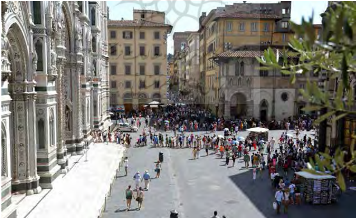
تصویر ۴. مجاورت بناهای تاریخی ارزشمند مانند کلیسای سانتا ماریا دل فیوره و عرصه‌های گشوده شهری اطراف آنها، سرزندگی میدان دل دوئومو فلورانس.

کلیسای جامع سانتا ماریا دل فیوره، کلیسای اصلی شهر در قلب تاریخی فلورانس قرار گرفته است. گشوده بودن محوطه اطراف این مجموعه، شامل کلیسا، برج ناقوس و بنای تعمیرگاه، یکی از نقاط قوت آن است. ساختمان هشت‌ضلعی تعمیرگاه سن جان، با حفظ فاصله‌ای، مقابل ورودی اصلی کلیسای سانتا ماریا دل فیوره بوده، درحالی‌که برج ناقوس جوتو به کلیسا چسبیده است. گذرهای متعددی که به این عرصه شهری منتهی می‌شوند، همه پیاده‌راه بوده و حضور سواره در لایه‌های دورتر امکان‌پذیر است. وجود یک حلقه پیاده‌محور، به شهروندان و گردشگران این امتیاز را می‌دهد که آزادانه در این فضای جمعی به فعالیت پرداخته و دغدغه نامنی فضا و تداخل حریم سواره و پیاده را نداشته باشند. مجاورت این مجموعه با محوطه‌ها و بناهای تاریخی متعددی مانند موزه سانتا ماریا دل فیوره، کلیسای سن لورنزو، میدان جمهوری و میدان سانتا ماریا نوولا یکی از عوامل موفقیت این فضای جمعی است. عظیم بودن کلیسا و برج ناقوس و تمایزی که در خط آسمان شهر فلورانس ایجاد کرده، منظر شاخصی از این مجموعه در ذهن افراد ثبت کرده و به خاطر ساز بودن آن منجر شده است. از آنجاکه هیچ‌یک از عناصر طبیعی در این میدان حضور ندارد، موفقیت این مجموعه می‌تواند وابسته به عوامل تاریخی و کارکردی آن باشد (تصویر ۴).