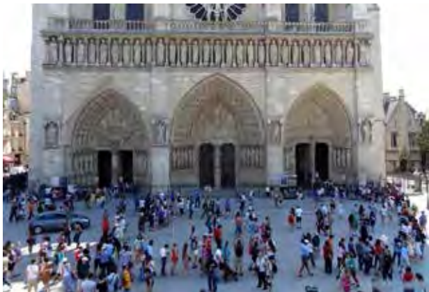
تصویر ۱. گشودگی عرصه مقابل کلیسای تاریخی نوتردام پاریس، فضایی مناسب برقراری تعاملات اجتماعی.