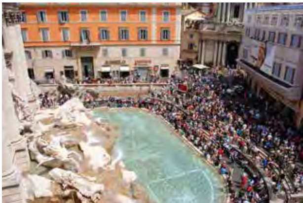
تصویر ۶. حضور عنصر منظرین آب و قدمت تاریخی بناها و خیابان‌های اطراف، میدان تروی رم.