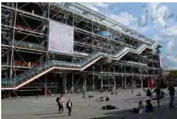
تصویر ۱۲. عرصه مقابل مرکز فرهنگی ژرژ پمپیدو مانند یک حیاط شهری شبانه‌روزی.