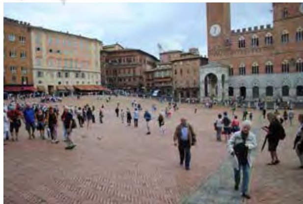
تصویر ۹. سرزندگی دل کامپو، میدان اصلی و مرکزی شهر تاریخی سیه‌نا.

میدان اصلی و مرکزی شهر سیه‌نا، در گذشته محل یک فوروم رومی بوده، سپس کارکرد یک بازار شهری داشته و در حال حاضر یک عرصه شهری فعال و شاخص‌ترین فضای جمعی شهر است. میدان دل کامپو در طول تاریخ، همواره مکانی برای تجمع افراد و برگزاری جشن‌ها، مراسم و مسابقاتی مانند اسب‌دوانی بوده و این امر در حافظه مردمان شهر، ثبت شده است. این میدان پیاده‌محور، هندسه و طرح متفاوتی دارد؛ پلان آن صدفی‌شکل است، در ترازوی پایین‌تر از معابر اطراف شکل گرفته و ۱۱ گذر به آن منتهی می‌شود. کف‌سازی میدان شامل ۹ شعاع آجر فرش (به نشانه فرمانروایی ۹ پادشاه از سال ۱۲۸۷ تا ۱۳۵۵ میلادی) بوده و همه شعاع‌ها شبیه به سمت مرکز (کاخ حکومتی) دارد. شیب حاصل از توپوگرافی طبیعی میدان، سبب می‌شود این فضا مانند یک آمفی‌تئاتر در خدمت مردم باشد. به این ترتیب، کاخ مردم و برج مانگیا، دقیقاً در مرکز دید افرادی است که بر روی کف میدان آرمیده‌اند. از سوی دیگر، شباهت بصری ساختمان‌های اطراف میدان به لحاظ رنگ، مصالح، جزئیات نما و مواردی از این قبیل، به وحدت و یکپارچگی فضا افزوده و درک و خوانش آن را برای مخاطب آسان می‌کند. موفقیت میدان دل کامپو عمدتاً مدیون عوامل تاریخی و کارکردی است (تصویر ۹).