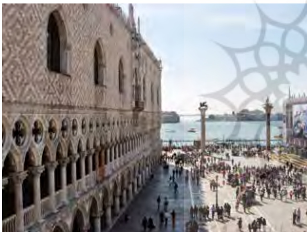
تصویر ۷. میدان سن مارکو ونیز حاصل ترکیب دو مستطیل و کشیدگی مستطیل فرعی در امتداد محور دید به دریا.