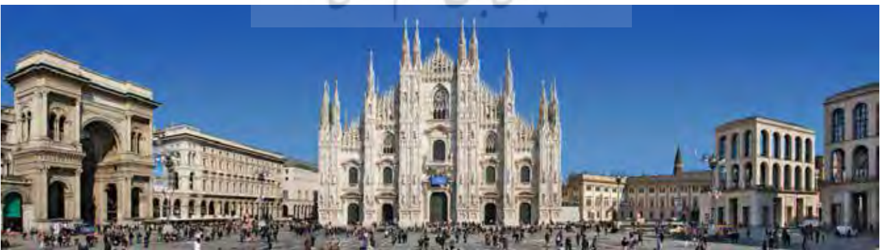
تصویر ۳. کلیسای تاریخی دوئومو و گالری ویتوریو امانوئل دوم (Galleria Vittorio Emanuele II) بناهای شاخص میدان دوئومو در میلان.