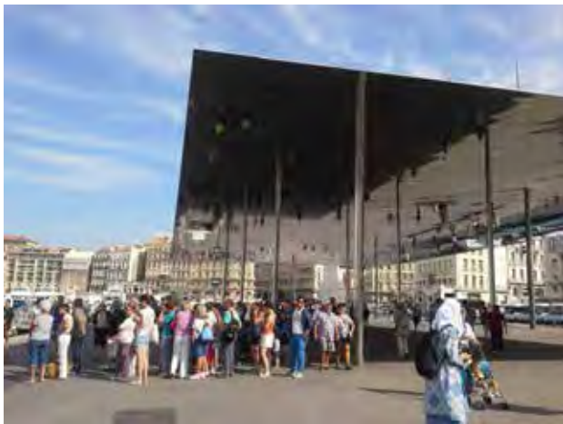
تصویر ۱۳. طراحی و ساخت پاریون جدید در بندر قدیمی و خاطره‌ساز مarse، مجاور دریای مدیترانه.

از عوامل موفقیت این فضای جمعی به شمار می‌رود. بنابراین موفقیت بندرگاه قدیمی مarse وابسته به هر سه عامل تاریخی، کارکردی و طبیعی است (تصویر ۱۳). حاصل مطالعه ۱۰ فضای جمعی در فرانسه و ایتالیا و بررسی عوامل موفقیت هر یک در جدول ۱ خلاصه می‌شود: