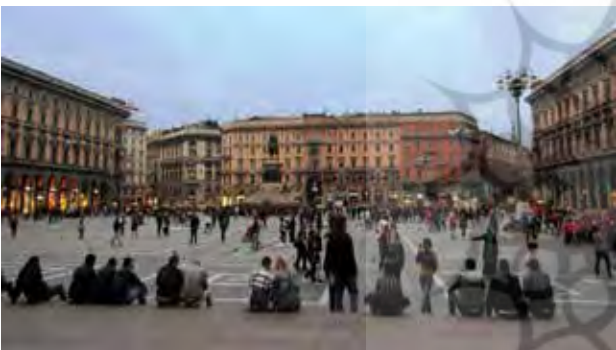
تصویر ۲. گشودگی و یکپارچگی میدان تاریخی دل دوئومو در میلان، امکان انجام فعالیت‌های گروهی خودجوش.