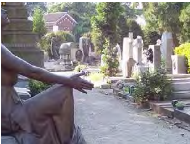
تصویر ۳. آرامستان میلان، ایتالیا. عکس: بهزاد مسعودی اصل، ۱۳۹۴.