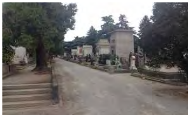
تصویر ۴. آرامستان میلان، ایتالیا.

بافت کالبدی و ساختار مکانی - فضایی آرامستان میلان یکی از مهم‌ترین ابعاد هویتی آن است، زیرا شکل‌گیری بافت کالبدی آن متأثر از اندیشه‌ها، باورها، فعالیت‌های اجتماعی و سطح فرهنگ آن جامعه است. هویت این مکان به واسطه ایجاد و تداعی خاطرات عمومی در شهروندان درک می‌شود و در این میان مجسمه‌ها، عناصر کهن، فضای مؤثرشان و روابط آن‌ها با محیط و معماری پیرامون، عوامل تقویت‌کننده ایجاد خاطره جمعی، حس تعلق به جامعه محلی و هویت مکانی است. در این آرامستان، هنرمندان مجسمه‌ساز و پیکرتراش به دنبال گسترش یک هویت عمومی و رشد و تعالی معنویات جامعه، از طریق هنر شهری با توجه به تأثیر آن بر تغییر رفتار اجتماعی بوده‌اند (تصویر ۴).