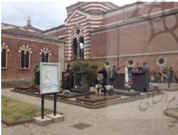
تصویر ۶. آرامستان میلان، ایتالیا. عکس: بهزاد مسعودی اصل، ۱۳۹۴.

این نشانه‌ها که گویای زندگی و شیوه حیات مردمان در عرصه‌های عمومی بر مبنای ویژگی‌های جغرافیایی بوده، حامل پیام‌هایی برای آیندگان نیز است و مفاهیم و موضوعات مختلفی را معرفی می‌کند. بطور کلی نشانه‌ها و نمادها در این آرامستان گویای طیف وسیعی از معانی است که باعث هویت بخشی آن شده و آن را از سایر پدیده‌های متفاوت و هم‌جنس قابل شناسایی می‌کند. ضمن اینکه بهره‌گیری از نظام این نمادها و نشانه‌ها در تحلیل فهم و نقد مناظر این آرامستان، خود یکی از نقاط قوت آن است. در نهایت این مجموعه عناصر یادمانی-هنری که از نظر تنوع و زیبایی شکل و محتوا (عاطفی، مذهبی، تاریخی، فرهنگی، سیاسی، ادبی و علمی