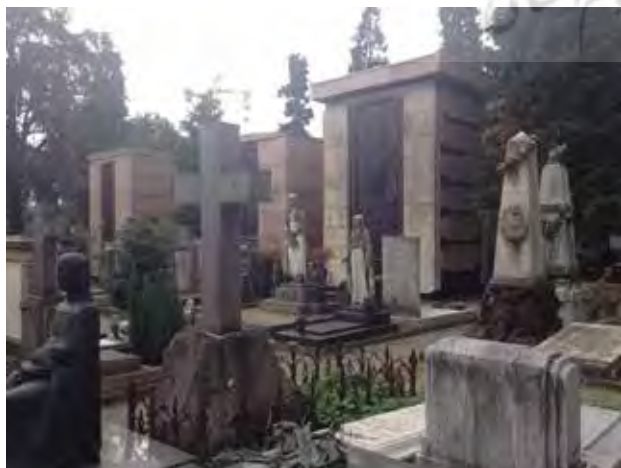
تصویر ۵. آرامستان میلان، ایتالیا. عکس: بهزاد مسعودی اصل، ۱۳۹۴.

«منظر، پدیده‌ای عینی - ذهنی، پویا و نسبی است که محصول تعامل انسان با طبیعت و جامعه با تاریخ است.» (منصوری، ۱۳۸۳). فرهنگ: «هر آنچه وابسته به باورهای روزمره گروهی از مردم و رفتارهای آن‌ها باشد.» (دبیری، ۱۳۸۸) و «منظر فرهنگی، حوزه‌ای جغرافیایی است که منابع طبیعی و فرهنگی را در اشتراک با رویدادهای تاریخی، فعالیت‌ها و افراد در برمی‌گیرد» (فیضی و رزاقی اصل، ۱۳۸۸: ۲۰). همچنین کمیته میراث جهانی یونسکو، منظر فرهنگی را به عنوان تمایز جغرافیایی سرزمین‌ها یا ویژگی منحصر به فرد آن، چنین تعریف کرده‌است: نمایشی مرکب از آثار طبیعی و انسانی. همچنین این کمیته منظر فرهنگی را به سه دسته اصلی بشرح ذیل تقسیم‌بندی کرده‌است: ۱. منظره‌ای که آگاهانه بوسیله انسان طراحی و خلق شده باشد. ۲. منظر اصیل تکامل یافته که ممکن است یک منظره به جامانده از گذشته یا منظره تداوم یافته از گذشته تاکنون باشد. این شکل منظر، از تعامل بین جوامع ابتدایی، معیشت و آداب و آیین‌های آنان با طبیعت بوجود آمده و شامل دو گونه است: منظر میراثی (فسیلی) که در یک فرآیند تکاملی در گذشته شکل گرفته و اکنون ویژگی‌های معنی‌دار و مشخص آن در محیط باقی مانده‌است (فرآیند تکامل، در گذشته خاتمه یافته‌است). منظر تداوم یافته (پایدار) نقش اجتماعی فعال در زندگی امروز دارد و از سنت‌های گذشته باقی مانده‌است. تکامل آن هنوز ادامه دارد و آثار و شواهد آن قابل شناسایی است. ۳. منظر فرهنگی مشترک (مختلط) که ممکن است به خاطر آیین‌ها، هنرها و آمیزش فرهنگ با عناصر طبیعی واجد ارزش شده باشد (UNESCO, 2005); (تصویر ۵).