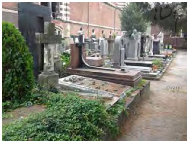
تصویر ۲. آرامستان میلان، ایتالیا.

آرامستان تاریخی میلان (Milan Monumental Cemetery) در زمینی با مساحت حدود دویست و پنجاه هزار مترمربع در طی سال‌های ۱۸۶۶ تا ۱۸۹۷ ساخته شده و طرح آن توسط «کارلوماکیاچنی»، معمار معروف ایتالیایی طراحی شده است. این مجموعه آرامستان عظیم درست در مرکز شهر میلان واقع شده و از لحاظ تاریخی و هنری دارای ارزش‌های فراوانی است. در قسمت ورودی این بنا، ساختمانی به سبک پانتونی موسوم به معبد مشاهیر وجود دارد که از انواع مختلف سنگ‌های مرمر ساخته شده است. این آرامستان یکی از برترین جاذبه‌های گردشگری میلان و دیدنی‌های ایتالیا است که شامل مجسمه‌ها، مقبره‌ها و بناهای یادبودی بوده و بسیاری از مقبره‌های آن متعلق به اشخاص مشهور است. آثار استادانه مجسمه‌های معاصر و کلاسیک ایتالیایی و همچنین معابد یونانی و دیگر آثار اولیه فلزی و سنگ‌های مرمر بکاررفته شده باعث ایجاد جذابیت این گورستان منحصر به فرد شده است. در این مکان تندیس‌هایی از موسیقی‌دانان، نویسندگان، هنرمندان، معماران، نقاشان، سیاستمداران، معلمان، ژنرال‌ها و برندگان جایزه نوبل وجود دارد. در سراسر این آرامگاه می‌توان تمثیل‌هایی از فرشتگان، قدیسیان و خدایان را با لبخندی رمزآلود یافت.