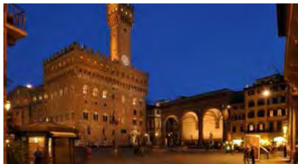
تصویر ۴. میدان های اصلی؛ مراکز اصلی شهرهای قرون وسطایی سمت راست میدان سینیوریتا در فلورانس.