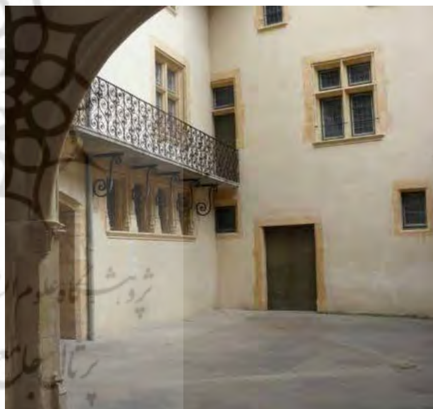
تصویر ۱۱. لیون و ونیز. بالا: چپ: مسیرهای اصلی، وسط: مسیرهای فرعی، راست: ورودی خانه‌ها. پایین: حیاط‌های میانی داخل خانه‌ها.

شاخصه‌های موردنظر در بررسی نظام محله‌های شهرهای نمونه شامل: ۱- هویت محله ۲- تعاملات و تعلقات اجتماعی است.