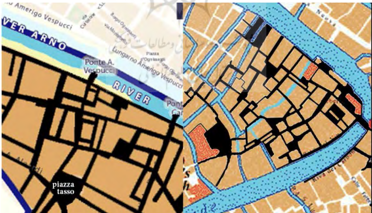
تصویر ۶. فضاهای پیوسته توسط دو یا چند میدان. سمت چپ: فلورانس، سمت راست: ونیز.

الف- پیوند بین مرکز شهر با مرکز محله، مانند فلورانس و لیون،