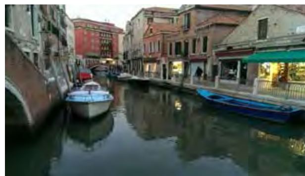
تصویر ۷. بالا: ونیز؛ پایین: لیون عکس: فرنوش دباغیان، ۱۳۹۴.