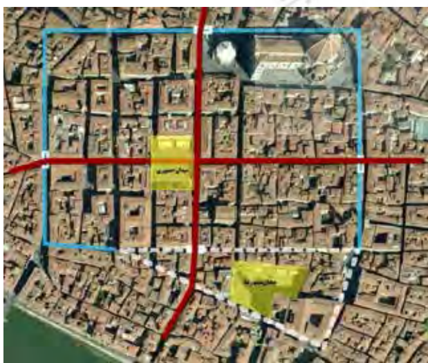
تصویر ۲. خطوط آبی حصار رومی را نشان می‌دهد.

۱- در لیون، میدان بلکور در زمان رومیان به عنوان میدان نظامی و تجاری و در قرن ۱۸ توسط لویی چهارم به عنوان میدان عمومی فعالیت داشته است و امروزه به عنوان بزرگترین میدان شهر، محلی برای تعاملات اجتماعی و برگزاری جشن نور عمل می‌کند. نقش این میدان در طی دوره‌های مختلف، به عنوان مرکز اصلی شهر حفظ شده و فعالیت‌های اجتماعی متفاوتی را به خود دیده است. ۲- در فلورانس، هسته اولیه رومی شهر، در شمال رودخانه آرنو شکل می‌گیرد. جایی که در امتداد دو مسیر شمالی- جنوبی و شرقی و غربی است و از تلاقی آن دو، مرکز شهر به شکل یک میدان مستطیلی پدید می‌آید که امروزه به میدان جمهوری معروف است. فلورانس نمونه بارزی از رشدمداری شهرهای اروپایی است و طی قرون متمادی حصارهای دور شهرگسترش می‌یابد. به طوریکه دو حصار قرون وسطی، یکی در اواخر قرن ۱۲ و دیگری قرن ۱۴ هسته اولیه رومی شهر را در بر می‌گیرد (موریس، ۱۳۷۴: ۱۰۴). در این میان «میدان سینیوریتا» نیز، به عنوان مرکز عمومی شهر قرون وسطی در طول بیش از ۶ قرن به عنوان مرکز فعالیت‌های مدنی و اجتماعی عمل کرده است (تصویر ۲).