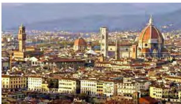
تصویر ۸. فلورانس؛ کلیسای سانتاماریا دلفیوره و ساختمان ارگ نظامی.