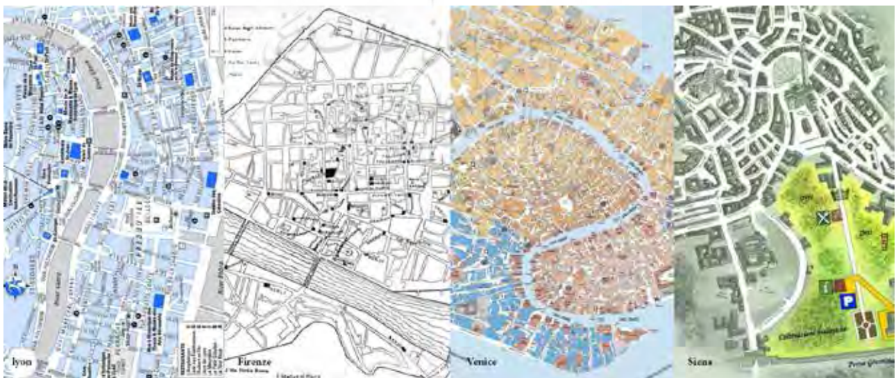
تصویر ۱. مقایسه الگوی شهری چهار شهر قرون وسطایی - لیون (فرانسه)، مأخذ: www.ontheworldmap.com - فلورانس، مأخذ: www.gutenberg.org ونیز، مأخذ: www.keywordsuggests.com سیه نا (ایتالیا)، مأخذ: www.orangesmile.com

بدین منظور در این پژوهش جهت تشخیص نظم حاکم بر اجزای شهر و چگونگی ساختار فضایی محلات در شهرهای قرون وسطی با تعیین شاخصه هایی در «ساختار کالبدی-فضایی» مانند (مرکزیت، ساختار، سلسله مراتب، الگوی شکل گیری قلمرو،