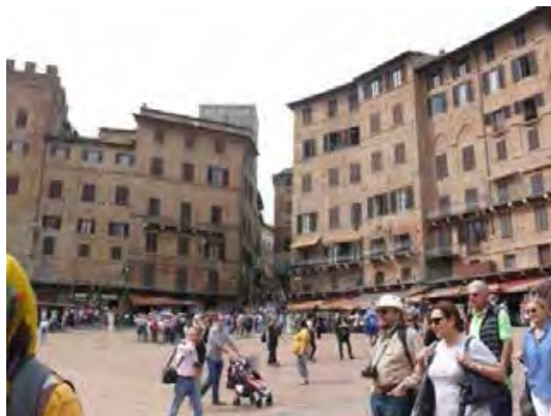
تصویر ۱۳: لیون-سیه نا، تعاملات اجتماعی در میدانی اصلی شهر یا در فضاهای باز میان بلوک های شهری . عکس: فرنوش دباغیان، ۱۳۹۴.