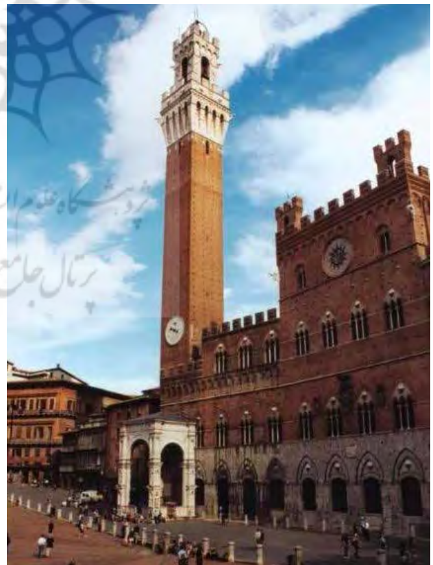
تصویر ۹. سیهنا - تالار شهر و برج آجری ساعت آن در میدان دل کامپو