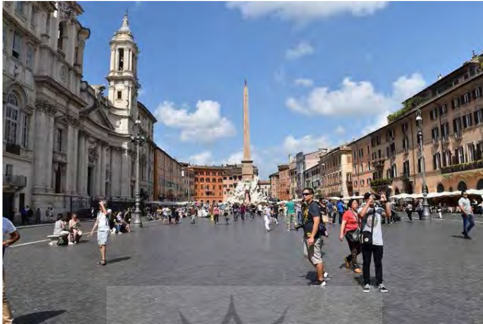
تصویر ۱. پویایی در میدان ناوونا در روم. عکس: زهرا بحرالعلومی، ۱۳۹۴.

فضای خارجی بسیار پویا، مطرح است. این میدان الهام گرفته شده از سیاست است تا مذهب و در محور کلیسای جامع و کاخ سناتورها قرار دارد و برای مناسبت های رسمی ایجاد شده است، در دو جبهه دیگر میدان، موزه کاپیتول (کاخ نو سابق) و کاخ هنرستان موسیقی (کاخ شهرداری سابق) قرار دارد. در واقع میکس آنژ با تغییر دادن شکل کامپیدولیو در روم اولین مجموعه میدان بسته و اولین میدان جمعی کامل را در عصر جدید به وجود آورد (همان: ۱۵)؛ (جدول ۳)؛ (تصویر ۲).