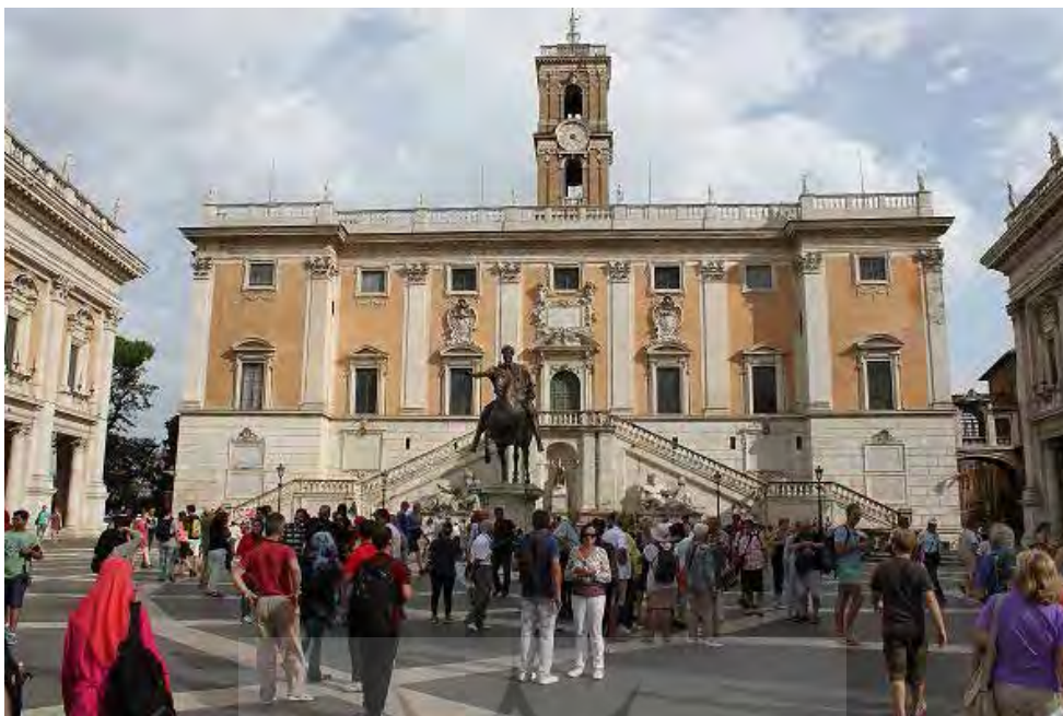
تصویر ۲. پویایی در میدان کاپیتول در روم.

اسب دوانی ۴ سنتی رایج شد و از سال ۱۶۵۶ هر ساله در آن مسابقه انجام می‌گیرد و تا به امروز هم ادامه دارد، یک مسابقه خطرناک و پرشور اسب‌دوانی که هر ساله بخاطرش جشنی در سراسر میدان سیه‌نا و جمعیت آنجا را باهم و کل شهر پیوند می‌دهد. بنابراین میدان کامپو نشانه شهری پرتحرک و مستقل است و تا ابد کانون و مرکز انکارناپذیر زندگی اجتماعی باقی‌می‌ماند. امروزه میدان دل کامپو به‌صورت آلفی‌تئاتر عمومی بزرگی به‌نظر می‌رسد، قهوه‌خانه‌ها، رستوران‌ها و غذاخوری‌ها، همه حاشیه بالای میدان را