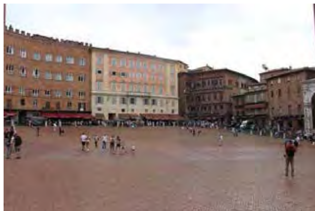
تصویر ۳. پویایی در میدان دل کامپو در سیه نا، عکس: زهرا بحرالعلومی، ۱۳۹۴.

میدان سن مارکو پروماینه‌ترین و در عین حال جسورانه‌ترین نمونه یک مجموعه میدان در اوایل نیمه قرن شانزدهم پدید آمد. در دوران عالی رنسانس این میدان نوسازی شده و به عنوان دروازه رسمی ورودی شهر طراحی شد. این میدان مانند میدان کاپیتول به صورت فضایی برای استقبال دولتمردان کشورها انتخاب شد. انتقال کلیسا به فضای میدان باسیلیکا و ضمیمه کردن آن به میدان، تسلط اثر بنا را تشدید می‌کند (همان: ۵۲) و میدان سن مارکو فضای جلوی باسیلیکا را ایجاد می‌کند. توسعه طرح میدان سن مارکو با ایجاد کتابخانه و بنای شهرداری در بخش جنوبی میدان در اواخر قرن شانزدهم به پایان رسید. امروزه تعداد زیادی میز و صندلی به صورت منظم و مرتب برای بازدیدکنندگان بین المللی چیده شده است و شور و شوق شیفتگی و جذابیت میدان سن مارکو همچنان باقی مانده است. در اطراف این میدان قهوه خانه‌ها، رستوران‌هایی با موسیقی زنده و مغازه‌هایی برای خرید قرار دارند (جدول ۵).