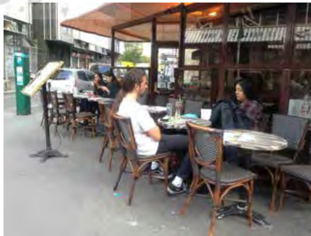
تصویر ۴: فضای شهری با قابلیت تبدیل شدن به فضاها و نشیمن های نیمه خصوصی.