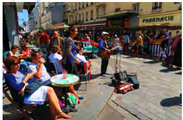
تصویر ۵. زندگی شهری و بروز رفتارهای اجتماعی. عکس: سیده فاطمه مردانی، ۱۳۹۴.