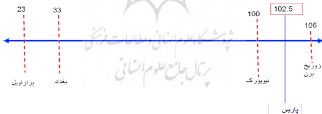
تصویر ۱. مقایسه شهرهای دنیا براساس استانداردهای بین‌المللی کیفیت زندگی.

با نگاهی دقیق به جریان معماری و شهرسازی حاکم بر فرهنگ‌ها و جغرافیاهای متفاوت، تلاش برای ساخت شهرها و فضاهای سکونتی منطبق بر نیازهای ساکنان و کاربران قابل مشاهده است. رضایتمندی سکونتی به عنوان یک پدیده اجتماعی پیچیده به شمار می‌آید که مفهوم آن از مفهوم مسکن و محیط اطراف آن پدیدار شده و از جمله مباحثی است که می‌تواند به عنوان شاخصه‌ای در جهت تحلیل، مقایسه و ارزش‌گذاری توانش پاسخ محیط مسکونی به نیازهای ساکنین به کار گرفته شود. این مفهوم که بر پایه ادراک از فضا بنا شده است، مجموعه‌ای از نیازهای کالبدی و ساختاری خانه تا اجتماع، شهر و خدمات جاری در آن را شامل می‌شود و بسیار ریشه در فرهنگ، جغرافیا و اقلیم خاص هر شهر و کشور دارد. اگرچه محققان فراوانی در این باره تحقیق کرده‌اند و به الگوها و عوامل تأثیرگذار مشترکی رسیده‌اند، با این حال بدیهی است که میزان نقش هر کدام از این متغیرها در پاسخ به رضایتمندی سکونتی، بسته به هر جغرافیا و زمان خاص، متفاوت است. این پژوهش با در نظر گرفتن نقش تأثیرگذار مکان مورد ارزیابی بر فرهنگ و تاریخ ساکنان آن، بر آن است تا با مطالعه‌ای مشاهده‌محور بر یکی از شهرهای مطرح اروپایی، نوع و میزان توانش عوامل تأثیرگذار بر رضایتمندی سکونتی را در شهر پاریس به عنوان نمونه موردی تحقیق، بررسی نماید. پاریس از آن