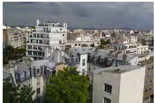
تصویر ۲. بافت مسکونی مرکزی شهر پاریس. عکس: محمدمهدی شعبانی، ۱۳۹۴.