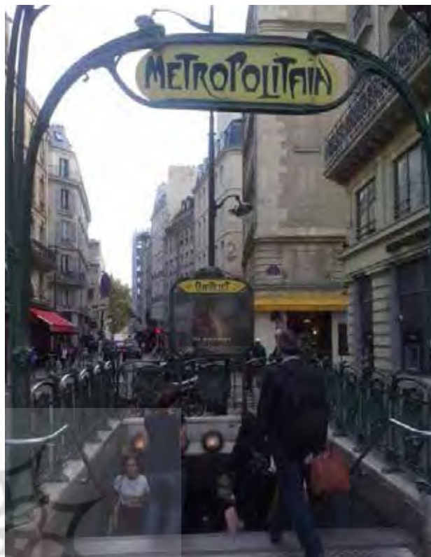
تصویر ۶. دسترسی سریع و فراگیر به خدمات حمل و نقل و خرید. عکس: محمد مهدی شعبانی، ۱۳۹۴.

آمدن کسب و کارهای کوچک محلی است. روشن است که در این مناطق، اینگونه امور بر مالکیت افراد بر فضای شهری می افزاید و باعث تعلق خاطر بیشتر شهروندان به فضای زیست شان می شود (تصویر ۶).