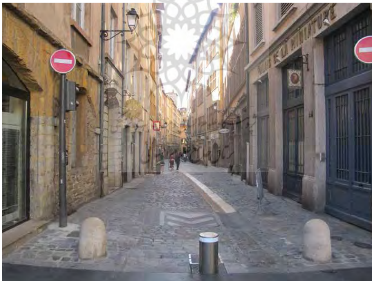
تصویر ۳. لیون تاریخی، یکی از محبوب ترین مکان های گردشگران، مولفه فرهنگی. عکس: پروانه پرچکانی، ۱۳۹۴.

اصلی شهر را رواج داده است و امروز جزو شهرهای پربازدید به شمار می‌رود. خارج کردن شهر، مکان، مقصد یا یک محصول خاص از شرایط معمولی و وارد کردن آن به شرایط ویژه با استفاده از مؤلفه‌های مختلف می‌تواند مفهوم نهایی برندسازی و معماری برند شهرها باشد که مؤلفه‌های فرهنگی ابزار اصلی این معماری است. برند شهری می‌تواند هرآنچه یک شهر از آن ساخته شده، آنچه نسل به نسل انتقال یافته و آنچه شهر را منحصر به فرد و متمایز از مکان‌های دیگر نموده را شامل شود (اخلاصی، ۱۳۹۳: ۷۸). با مشخص شدن جایگاه برند شهرها، معماری برند با توجه به ظرفیت‌های شهر آغاز می‌شود و ارتباطات برند و معماری آن با توجه به هویت فرهنگی و تاریخی و مؤلفه‌های موجود تعیین می‌شود تا شهر در زمینه خاصی به شهرت برسد و بتواند سرمایه اقتصادی زیادی از طرق مختلف سرمایه‌گذاری و گردشگری به دست آورد و در زمینه گردشگری شهری پرآوازه شود.