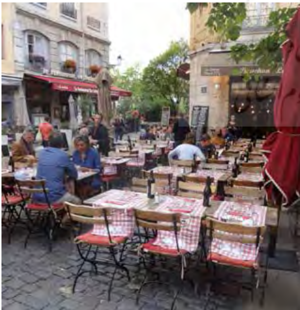
تصویر ۴. غذاهای لیون دارای شهرت جهانی. عکس: پروانه پرچکانی، ۱۳۹۴.

شاید بتوان عوامل موفقیت برندسازی در لیون را همدلی و تعلق خاطر مردم به نمادهای ملی و آیین‌های قدیمی از یکسو و وجود تاریخ غنی، پیشینه فرهنگی، معماری، تجاری و آیینی شهر از سوی دیگر دانست که در همراهی با مدیریت منسجم در طراحی زیربندها براساس مولفه‌های فرهنگی و تاریخی و تلاش برای توسعه آن‌ها با توجه به عوامل داخلی و خارجی و همچنین میل به پیشرفت و توسعه شهر از سوی مردم و مدیران شهری نتایج مثبتی به جای گذاشته است.