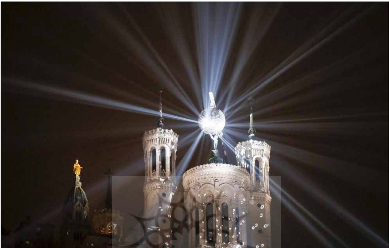
تصویر ۵. جشنواره نور لومیر، برند شهر لیون، مأخذ: خبرگزاری مهر.