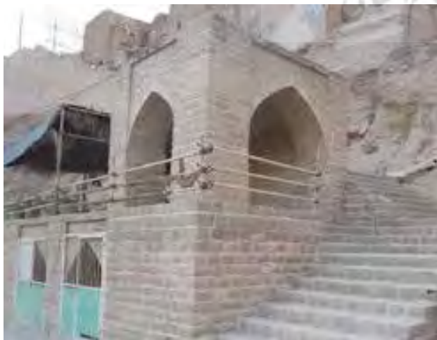
تصویر ۲. نمایی از چارطاقی.

بدون شک در شکل گیری این مجموعه منحصر به فرد علاوه بر تفکر و آراء تعدادی از صاحب نظران، آداب و رسوم مردمانی که در این خطه زندگی می کرده اند بی تأثیر نبوده است، چنانکه علاوه بر فنون آبیاری سیار پیشرفته در این مجموعه، با نمونه هایی از مسایل فرهنگی نیز روبرو هستیم که از جمله می توان به چارطاقی های موجود اشاره نمود. مسئله دیگری که قابل ذکر است، معماری برون گرای برخی منازل مشرف به مجموعه است که با فرهنگ ایرانیان سنخیت نداشته، چرا که ایرانیان به حفظ حریم معماری درونگرا را داراست. بدون شک این نوع معماری صرفاً جهت استفاده از چشم انداز طبیعی مجموعه، پیاده شده است. همچنین «کرزن» در کتاب خویش تحت عنوان «ایران و قضیه ایرانیان»، آبشارهای شوشتر را تا حدودی مشابه با آبشارهای هوراتی در تیرولی (ایتالیا) می داند (تصویر ۲).