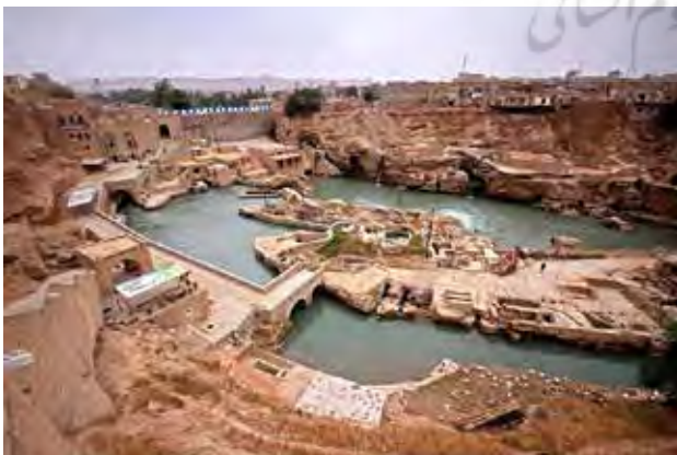
تصویر ۱. نمایی از مجموعه آسیاب‌های آبی شوشتر. عکس: میلاد معصومی، ۱۳۹۲.

دیدگاهی گردشگری را به عنوان مصرف‌کننده می‌بیند، در حالی که امروزه گردشگری می‌بایست وسیله‌ای باشد برای حفظ و نگه‌داشت میراث‌های طبیعی و فرهنگی در جهت نیل به اهداف توسعه پایدار.