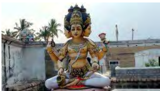
تصویر ۷. برهما، معبدی نزدیک تامیل نادو.