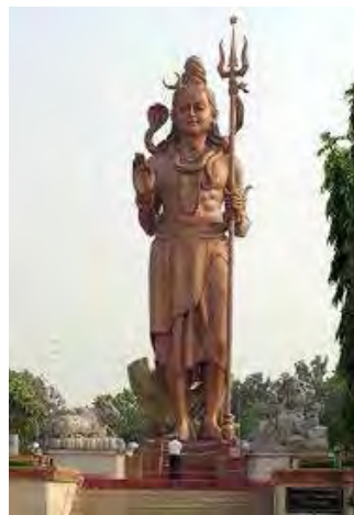
تصویر ۲۳. شیوا، معبدودیانان (Vaidyanath) در دگره جارکند (deogarh, jharkhand)