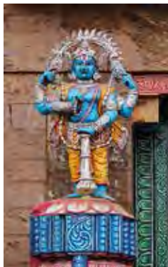
تصویر ۱۳. ویشنو، معبد جاگانات (Jagannath) واقع در ادیشا (Odisha).