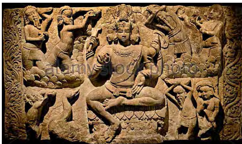
تصویر ۳. برهما، سقف معبد هوچکاپایا گودی (huchchappaiyya-gudi) واقع در بیجاپور (aihole-bijapur).