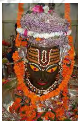
تصویر ۲۹. شیوا، معبد ماهاکالشوار (Mahakaleshwar) واقع در مادیاپرادش (Ujjain, Madhya Pradesh)