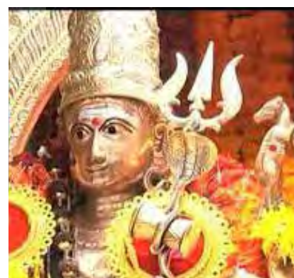
تصویر ۲۸. شیوا، معبد ملیکار جونا سوامی (Mallikarjuna Swamy) واقع در اندراپرادش (Srisailam, Andhra Pradesh)