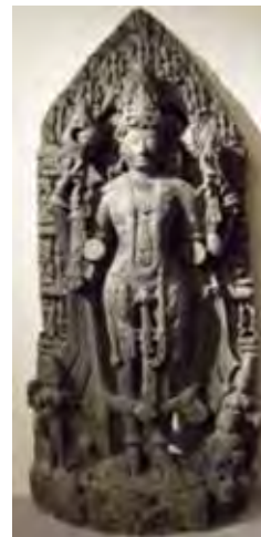
تصویر ۸. ویشنو، موزه گویمت (Guimet) پاریس