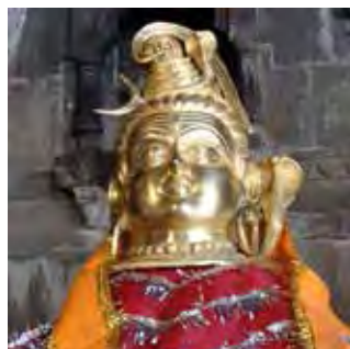
تصویر ۳۲. شیوا، معبد تریمبکاشوار (tryambakeshwar)