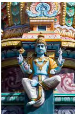
تصویر ۱۰. ویشنو، معبد گاپورام (gopuram) واقع در ایندیاسور (indiasur)