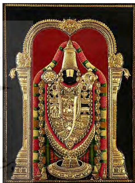
تصویر ۱۵. ویشنو، معبد تیروپاتی تیرومالا بالاجی (Tirupati Tirumala Balaji).