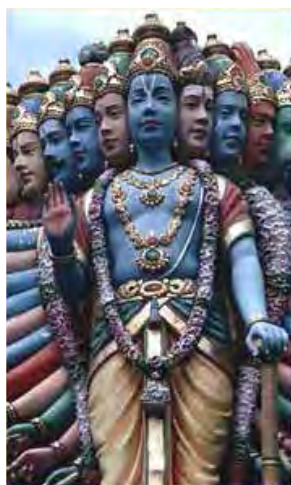
تصویر ۱۱. ویشنو و تجلیاتش

ویشنو از خدایان اصلی ریگ‌ودا است که او را خدای نگه‌دارنده و نیروی اتصال اجزای عالم می‌دانند. او خدایی مهربان و محافظ کائنات است و تداوم هستی را تضمین می‌کند. در آیین متأخر