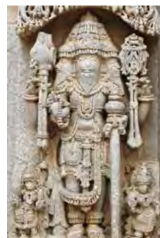
تصویر ۲. برهما، معبد چناکساوا (Chennakesava) واقع در سمانتاپورا کارناتاكا (Somanathapura, Karnataka) قرن ۱۲م.