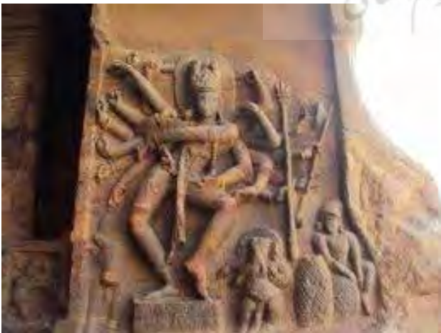
تصویر ۲۰. شیوا، قرن ۸ قبل از میلاد.

خدای ویرانگر است که جهان را نابود کرده و دوباره جهان از نو به وجود می‌آید که شباهت‌هایی به رودرا، خدای کهن ودایی ۱۳ دارد. او تا حدودی، خدایی بامحبت است که لطف سرشاری به بندگان دارد و این تصور وجود دارد که به زمین نزول می‌کند و قالب خاصی به خود می‌گیرد. او با شفاعت کردن برای کسانی که او را پرستش می‌کنند، به آنها کمک می‌کند؛ اما شیوا، نقش ویرانگری نیز دارد؛ البته هندوها معتقدند که این ویرانی برای بازآفرینی و تولد دوباره موجودات است. در دوران ماقبل تاریخ، شیوا را خدای حاصلخیزی و باروری می‌دانستند و به دلیل قدرت ویرانگری‌اش، او را می‌پرستیدند. تصاویر او را به صورت‌های گوناگون ترسیم کرده‌اند و بر همین اساس، نام‌های دیگری نیز برای او وجود دارد که معروف‌ترین آنها «شیوای رقصان» است. در تصاویر و تمثیلی که برای شیوا ارایه شده، معمولاً چشم سومی نیز در وسط پیشانی تصویر شده که همواره نیمه‌باز است و پیروان او اعتقاد دارند که این چشم سوم در روز معینی گشوده خواهد شد و جهان را زیر و رو خواهد کرد. شیواپرستان، سرچشمه رود مقدس گنگ را گیسوان شیوا می‌دانند.