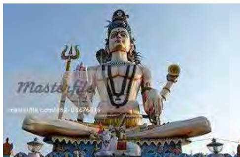
تصویر ۳۳. شیوا، معبد امکارشوار (Omkareshwar)، ۲۰۰۷ م. واقع در مادیاپرادش (Madhya Pradesh)