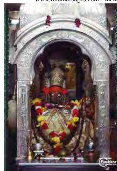
تصویر ۴. برهما، معبد پوشکار.