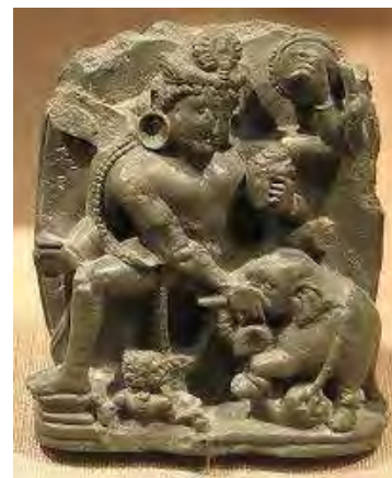
تصویر ۱۸. ویشنو، معبد رسکینگ گاجندرا (rescuing Gajendra) واقع در جامو و کشمیر (Jammu & Kashmir)، قرن ۸ و ۹ م.