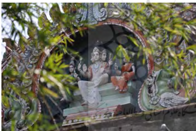
تصویر ۵. برهما، معبد سیرکازی (Sirkazhi) واقع در تامیل نادو (Tamil Nadu)