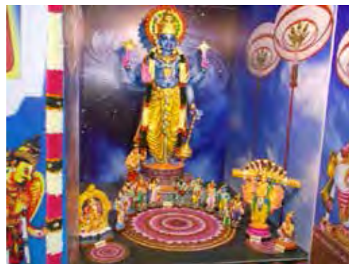
تصویر ۱۲. ویشنو، معبد سریرانگام رانگاناتاسوامی (Srirangam-Tiruchirappalli) واقع در تامیل نادو (Tamil Nadu)