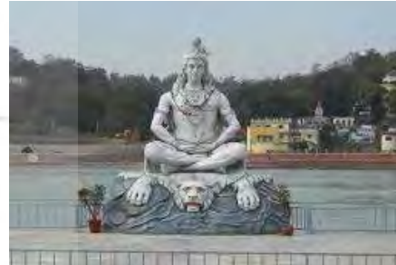
تصویر ۲۵. شیوا، معبد کدرانات (Kedarnath) قرن ۸م. واقع در اتارکند (Uttarakhand)