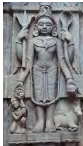
تصویر ۲۲. شیوا، معبد تریمبکاشوار (Trimbakeshwar) سال ۱۷۵۵م. واقع در ناسیک، ماهاراشترا (nasik, maharashtra)