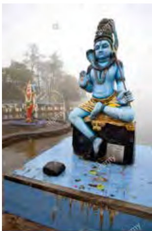
تصویر ۲۴. شیوا، در معبد سربکاشی، ویشوانات (Sri-kashi-vishwanath) واقع در بنارس. قرن ۱۸م.