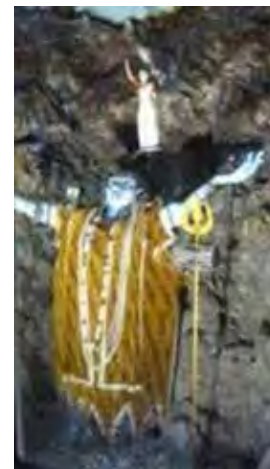
تصویر ۲۱. شیوا، معبد، دهلی. عکس: شهره جوادی، ۱۳۹۰.