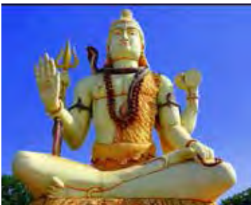
تصویر ۲۷. شیوا، معبد نگشوار (Nageshwar) واقع در جمنگر، گجرات (Jamnagar, Gujrat)