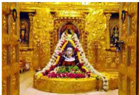
تصویر ۳۱. شیوا، معبد سومنات (somnath) واقع در ایالت گجرات.

بر تن دارد. در یکی از دست‌های راست او طبل و دست دیگر به علامت اینکه انسان نباید بیم و هراس به خود راه دهد بلند شده و بر روی پوست ببر نشسته است. در بعضی تصاویر لباسی از پوست ببر هم بر تن دارد.