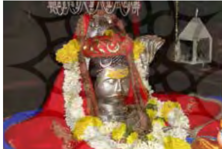
تصویر ۲۶. شیوا، معبد بیماشانکار (Bhimashankar) واقع در پون ماهاراشترا (Pune, Maharashtra)، قرن ۱۳م.