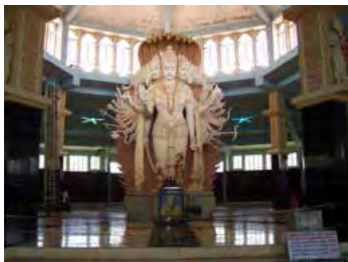
تصویر ۱۴. ویشنو، معبد بدرینات (Badrinath) واقع در اتارکند (Uttarakhand)