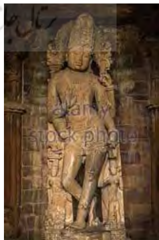
تصویر ۹. ویشنو، معبد چاتوربوجا (chaturbhuj) واقع در خاجوراهو (khajuraho)