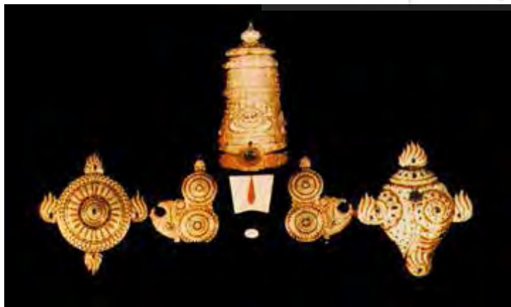
تصویر ۱۹. نشانه‌های ویشنو.