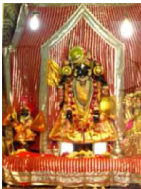
تصویر ۱۷. ویشنو، معبد، ادیپور. عکس: شهره جوادی، ۱۳۹۱.