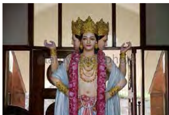
تصویر ۶. برهما، معبد ایسکن (iskon) واقع در دهلی (delhi-uttar-pradesh)