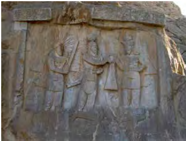
تصویر ۱۰. مهر با تاج خورشید بر نیلوفر آبی، عکس: سید امیر منصوری، آرشیو پژوهشکده نظر، ۱۳۹۲.