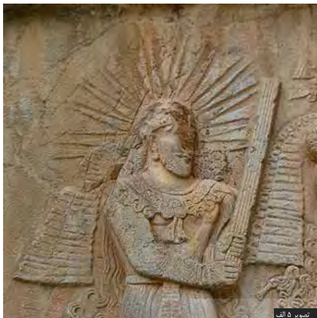
تصویر ۵ الف

در ارتباط با آب و ایزد بانو اناهیتاست. پارچه‌های ابریشمی و زربفت این دوره نیز به انواع نقش‌های برگرفته از طبیعت و باورهای طبیعت‌گرا مزین است (تصویر ۴).