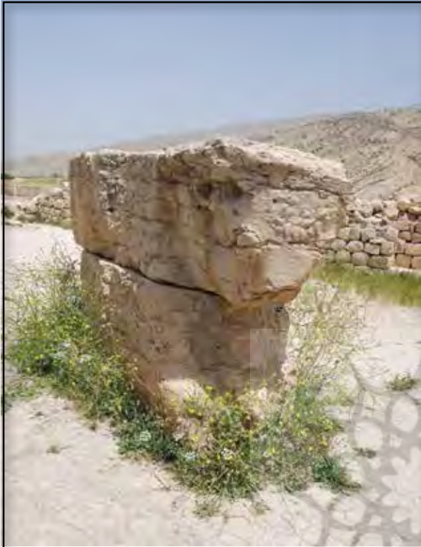
تصویر ۱۵. معبد اناهیتا، بیشاپور، عکس : ایدا آل هاشمی، ۱۳۸۸: ۶۱