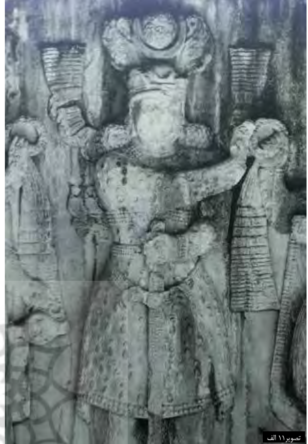
تصویر ۱۱ الف

تصویر ۱۱. الف: لباس خسرو پرویز، با مرواریدهایی به شکل قطره آب، عکس: سید امیر منصوری، آرشیو پژوهشکده نظر، ۱۳۹۲. ب: تاج اناهیتا مزین به شکوفه‌های گل و مروارید. عکس: سید امیر منصوری، آرشیو پژوهشکده نظر، ۱۳۹۲.