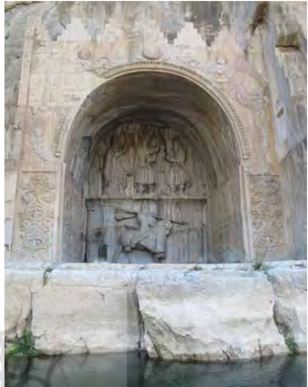
تصویر ۸. تاق بستان، شکارگاه خسرو پرویز، غار معبد احتمالاً در ارتباط با مهر و اناهیتا، عکس: سید امیر منصوری، آرشیو پژوهشکده نظر، ۱۳۹۲.

نزدیکی این مکان وجود دارد که نشان می‌دهد از گذشته تاکنون مکانی محترم بوده و مجاورت آن با آب ارتباط با اناهیتا، الهه باروری و نگهبان آب‌ها را آشکار می‌سازد. از این مکان با تعلق به دوران اشکانی - ساسانی به‌عنوان شکارگاه نیز یاد شده است. البته مغایرتی بین شکارگاه و نیایشگاه نیست؛ زیرا در زمان ساسانی هردو در کنار هم وجود داشته‌اند. چنان‌که تاق بستان، شکارگاه خسرو پرویز در کرمانشاه از پردیس‌های ساسانی بوده و آثاری بارز از غارهای مزین به نقش اناهیتا و هم‌چنین نقش برجسته مهر یا میترا در آن دیده می‌شود.