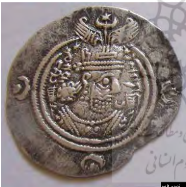
تصویر ۵ ب