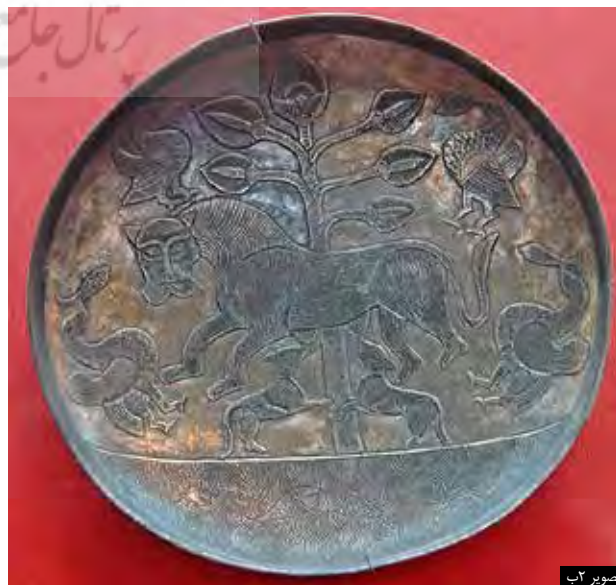
تصویر ۲ ب