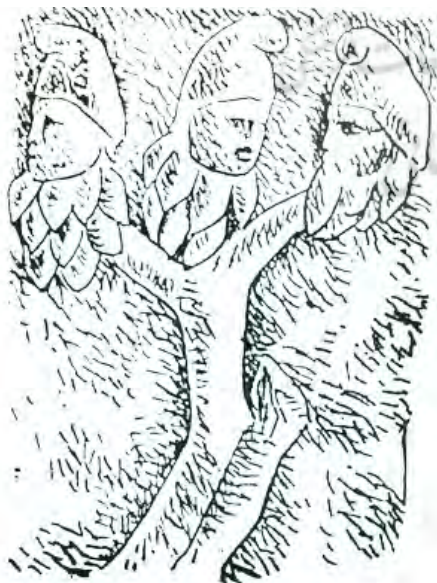
تصویر ۱. زایش میترا از درخت سرو، مأخذ: ورمازرن، ۱۳۸۳: ۹۰.

عظمت و جذابیت آثار مذهبی ایرانیان باستان در ارتباط با طبیعت در اقوال سیاحان اروپایی بسیار ستوده شده است. نمونه‌هایی که تاکنون موجود است و یا آن دسته که از بین رفته‌اند در سفرنامه‌ها و تصاویر قدیمی موجودند. در گزارشات «فلاندن» و «کوست» (آکادمی علوم فرانسه) از چشم‌انداز طبیعی بیستون به‌عنوان اقامتگاه بیلاقی و شکارگاه ساسانیان یاد شده است. «جکسن» شرق‌شناس آمریکایی، صفت فرهادتراش بیستون را به دوران هخامنشی نسبت می‌دهد.