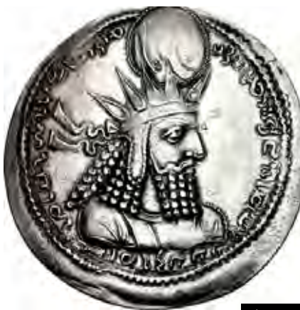
تصویر ۵ ب

تصاویر ۵. الف : شعاع نور از نمادهای مهر، نقش برجسته میترا، تاق بستان. ب : سکه ساسانی (خسرو دوم)، پ : بهرام اول. مأخذ : امینی، ۱۳۸۵ : ۳۶۳، ۲۵۴.