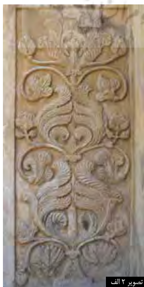
تصویر ۲ الف