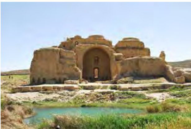
تصویر ۷. کاخ اردشیر، فارس، عکس: فرنوش پورصفوی، آرشیو پژوهشکده نظر، ۱۳۸۸.

اردشیر در فیروزآباد، روی تپه و مشرف به چشمه‌ای جوشان، اثری منحصر به فرد است که ترکیبی از معماری پارت و ساسانی را نشان می‌دهد (تصویر ۷). بقایای سه‌تالار با گنبد، متعلق به دوره ساسانی بوده و ایوان و حیاط، به شیوه معماری اشکانی است که در دشت وسیعی قرار دارد و همچون دیگر بناهای این عصر در ارتباط با چشمه و آب بوده؛ به گونه‌ای که تصویر بنا که آتشکده، کاخ یا اقامتگاه موقت شکارگاه بوده در آب منعکس می‌شود. تصویر غار معبد ۱ تاق‌بستان (تصویر ۸) با سنگ‌نگاره‌های باشکوه در دل صخره‌های عظیم، بر نهر جاری از چشمه منعکس شده است. این مکان یکی از مشهورترین پردیس‌های ساسانی است که به شکارگاه خسرو پرویز مشهور است. سنگ‌نگاره‌های موجود در این مکان اشاراتی به دین و باورهای این عصر دارد. نقش تاجگذاری خسرو پرویز، حضور اهورامزدا و اناهیتا و تاج‌گیری اردشیر دوم از اهورامزدا، حضور میترا نشانه‌های آشکاری را در ارتباط با عناصر استوره‌ای طبیعت نشان می‌دهند.