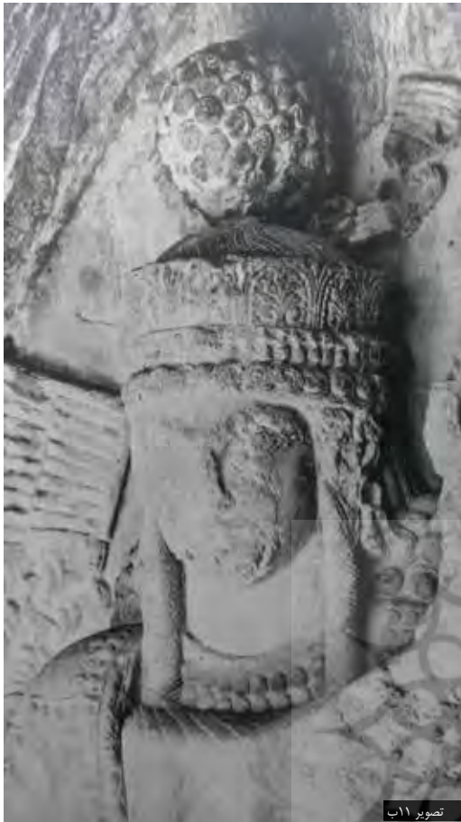
تصویر ۱۱ ب