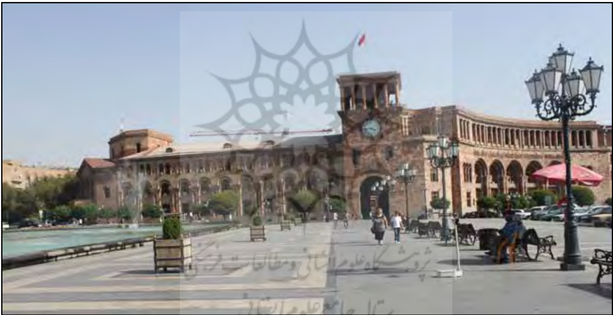
تصاویر ۶ و ۷. طراحی نامناسب فضای جمعی در میدان جمهوری ایروان موجب شده این فضا در طول روز فضایی خالی از جمعیت و محل گذر باشد، ارمنستان، عکس: ریحانه حجتی، آرشیو مرکز پژوهشی نظر، ۱۳۹۲.

می‌کرده، با مرمت‌های اخیر به کلی ویژگی‌های سنتی خود را در ساختار و عملکرد از دست داده است. احداث کاربری‌های تجاری با دهنه‌های بزرگ که غالب آنها خالی و بی‌رونق بوده و استفاده از میلمان با الگوهای اروپایی محصول رویکرد کالبدمحور غربی است نه برآمده از نیازهای مردم شهر. مردم این شهر نه توانایی مالی برای تملک این فضاهای تجاری را دارند و نه مقیاس فعالیتی آنها با فضاهای جدید ایجاد شده همخوانی دارد (تصویر ۹). نتیجه آنکه این فضای مرکزی که می‌توانست محلی برای عرضه صنایع دستی مردم شهر، برگزاری کارناوال‌های محلی و گفتگوی اهالی