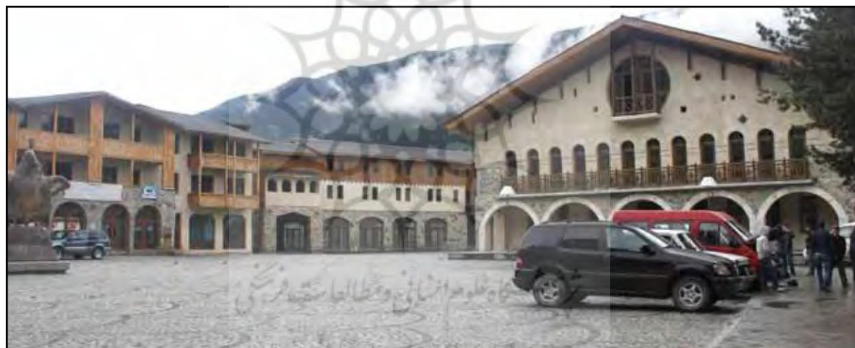
تصویر ۹. مرکز شهر مستیا تنها تقلیدی صوری از نمونه‌های غربی بوده و در آن فعالیت‌های مناسب برای ایجاد تعامل میان مردم شهر در نظر گرفته نشده است. مستیا، گرجستان، عکس: ریحانه حجتی، آرشبو مرکز پژوهشی نظر، ۱۳۹۲.