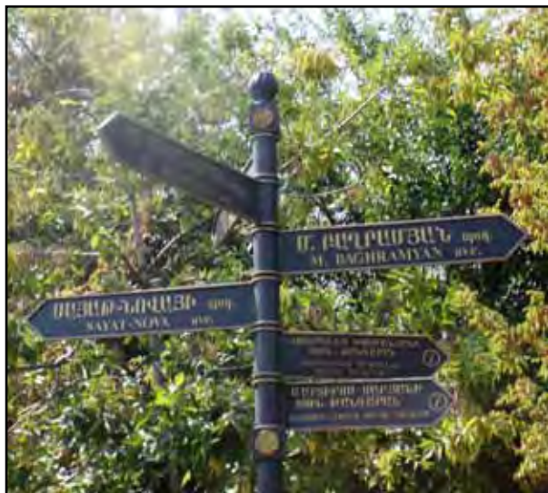
تصویر ۸. استفاده از میلان شهری با تقلید از میلان شهری پاریس نمونه‌ای از رویکرد غرب‌گرای مدیریت شهری ایروان است. ارمنستان، عکس: ریحانه حجتی، آرشبو مرکز پژوهشی نظر، ۱۳۹۲.