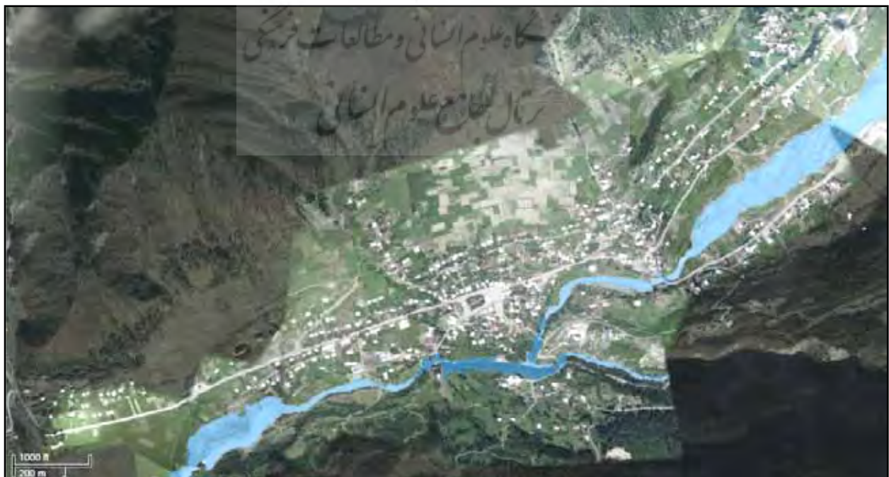
تصویر ۳. تفکیک سکونت و کشاورزی در دامنه‌های شمالی و جنگل‌داری در دامنه‌های جنوبی دره مستیا، گرجستان.

خانواده‌های ساکن مستیا که تحت نظام فتودالی زندگی کرده و عمدتاً از راه کشاورزی امرار معاش می‌کردند، برای مقابله با غارت بیگانگان و تأمین امنیت، متناسب با شرایط طبیعی و جغرافیایی، تمهیدات متفاوتی اندیشه کرده و همچنین به گونه خاصی از معماری روی آوردند. هریک از گروه‌های خانواری در کنار خانه و تجهیزات متعلق به خود، یک برج مراقبت سنگی و یک دیوار دفاعی پیرامون زمین خود ساخت (Gilbert, 1992). به این دلیل که ساخت برج و بارو بر روی دامنه کوه‌ها و دره‌ها ممکن نبود، تجهیزات دفاعی به صورت پراکنده و مجزا در سطح شهر شکل گرفت. به این ترتیب موقعیت استراتژیک مستیا، نقش مهمی در ایجاد ساختار منظر دفاعی آن داشته است (تصویر ۱). منظر دفاعی مستیا به شکل برج‌های مرتفع سنگی متعلق به یک