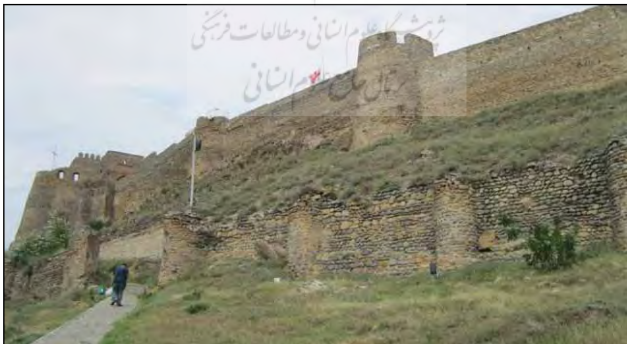
تصویر ۵. قلعه گوری، منظر دفاعی یکپارچه، متمرکز و درونگرا، گوری، گرجستان. عکس: سیده فاطمه مردانی، آرشیو مرکز پژوهشی نظر، ۱۳۹۲.

بهره بیشتری از نور جنوب دارند، برای سکونت و کشت انتخاب شده و در دامنه‌های جنوبی جنگل کاری کرده‌اند (تصویر ۳). از سوی دیگر خانوارها برای مقابله با مسئله غارت، ناگزیر به ساخت