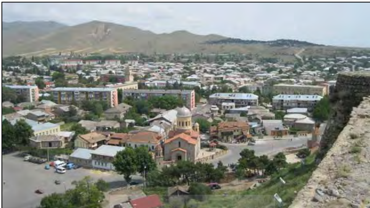
تصویر ۴. منظر شهر گوری از داخل قلعه که بر روی بلندی‌های شهر ساخته شده. گوری، گرجستان.

گونه خاصی از معماری بودند. بنابراین معماری دفاعی مستیا به صورت تک‌برج‌های پراکنده، غیرمتمرکز و خانوادگی شکل گرفته است.