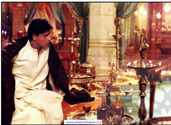
تصاویر ۱ و ۲. تصویرسازی مکانی از شکوه و ثروت در فضای داخلی فیلم دیوداس.

شیدایی و صعود عاشقانه یا شتابی در رسیدن به آخرین لحظه‌های عاشقانه است. در فصل پایانی، دیو بیمار و شکست‌خورده، کنار رود مقدس گنگ است. رود گنگ مقر دل‌های آرزومند و نیازمند است که همیشه مورد توجه سینمای کلاسیک بوده است. تنها مکان‌سازی مفهومی و البته کم‌رنگ این فیلم، کفسازی شطرنجی کاخ دیوداس است. این نوع کفسازی از کفسازی‌های رایج در کاخ‌های هندی است. نمایش کفسازی شطرنجی در لحظه ورود پارو به کاخ و بعد در سکانس‌های بعدی، خروج دیو از کاخ و حرکت آرام او بر روی کفسازی شطرنجی، تداعی بازی شاهانه