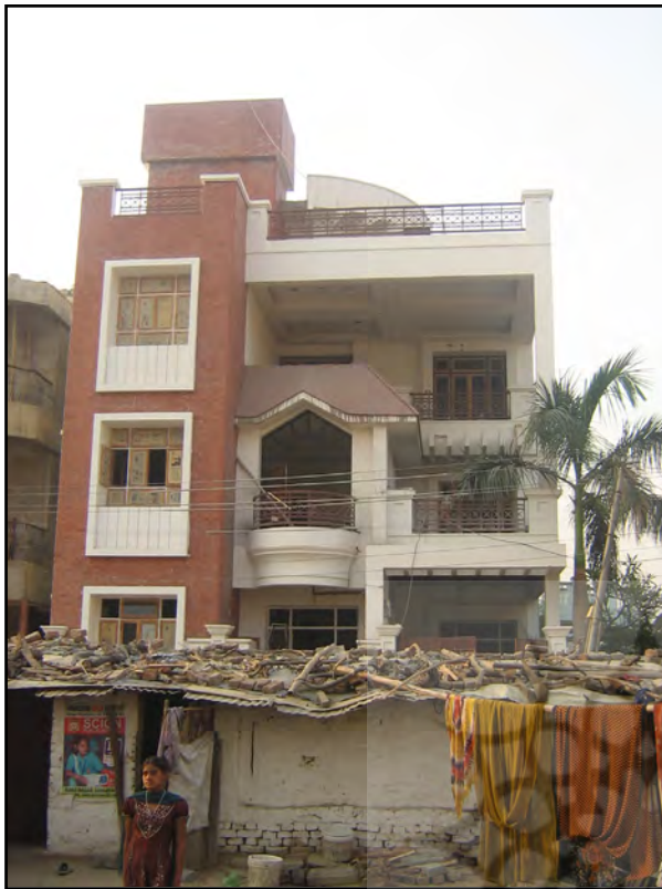
تصاویر ۱۲ و ۱۳. تضاد شدید طبقاتی و همجواری طبقه مرفه و محروم در یک مکان.

نهفته است. در این تصاویر بهتر از هر مستندی با واقعیت زندگی در هند آشنا می‌شویم. زندگی «جمال» و برادرش «سلیم» در