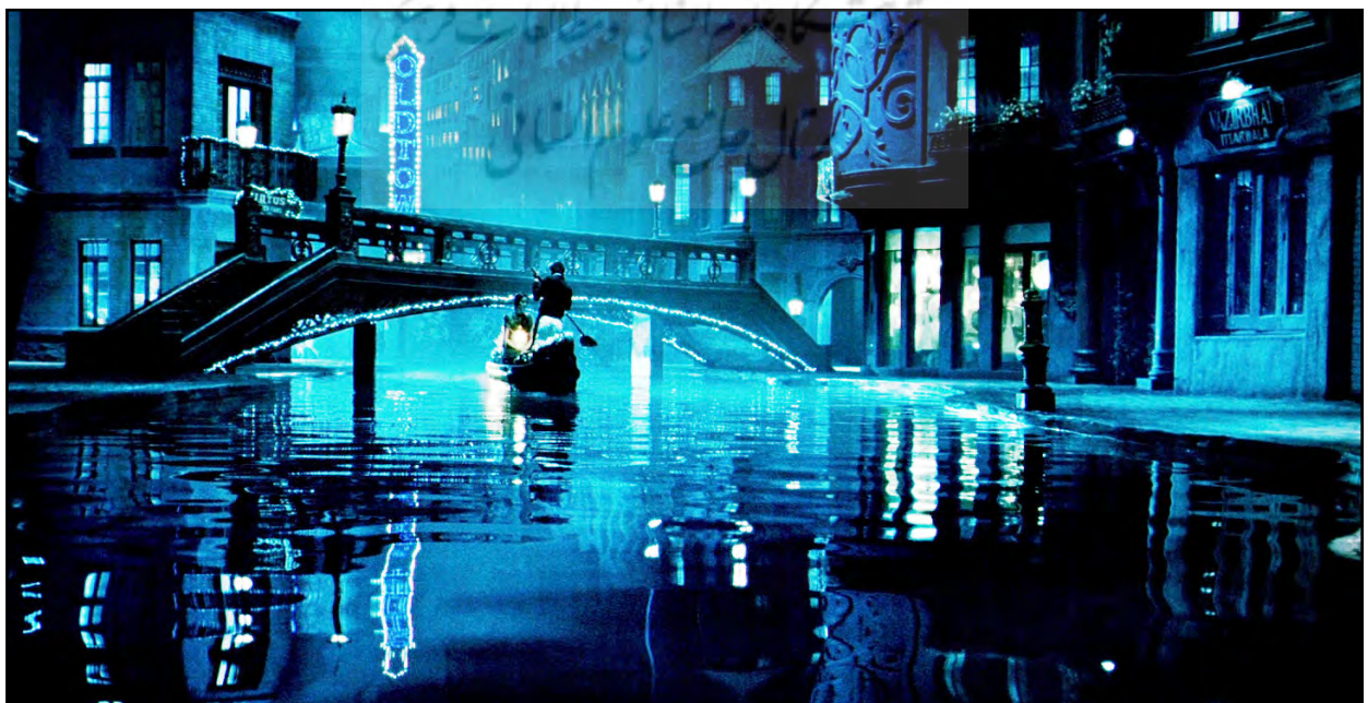
تصویر ۱۰. پل روی رود؛ مهمترین مکان فیلم و محل وقوع اصل داستان. فیلم ساواریا. مأخذ: www.saawariyafilm.com .