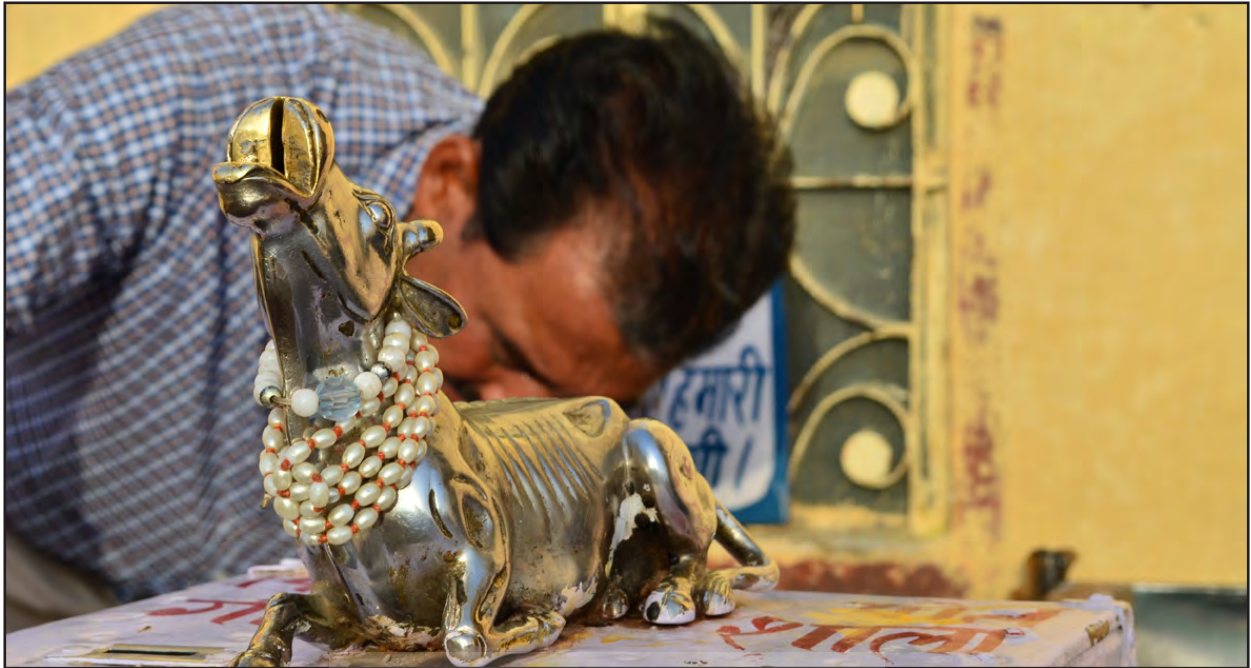
تصویر ۳. گاو مقدس سپید و مرکب شیوا، مدخل معبد شیوایی، جیپور، هند. عکس: زهره شیرازی، ۱۳۹۱.