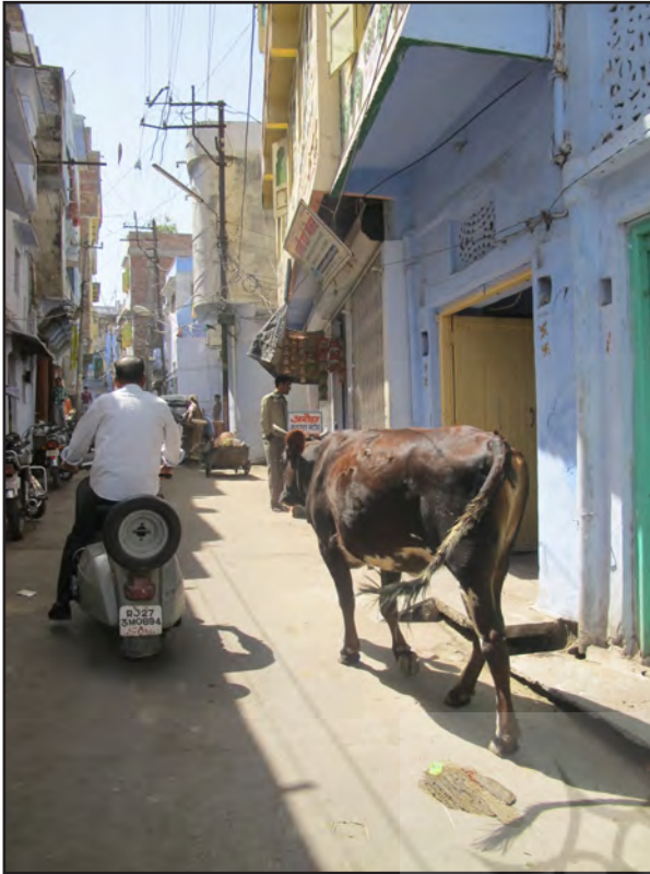
تصویر ۲. جدا نبودن زندگی گاو از زندگی شهری مردم هند. ادیپور، هند.

هند شاهدیم این حیوان چگونه بر نوع زندگی، روابط اجتماعی و حتی رانندگی‌شان، تأثیر فراوان گذاشته است. شیرش برای نیازمندی همگانی کافی است. رانندگی مردم در این سرزمین با نظم پیچیده‌اش، آمیخته با حرکت گاو در معبر عمومی شهرشان است (تصویر ۲).