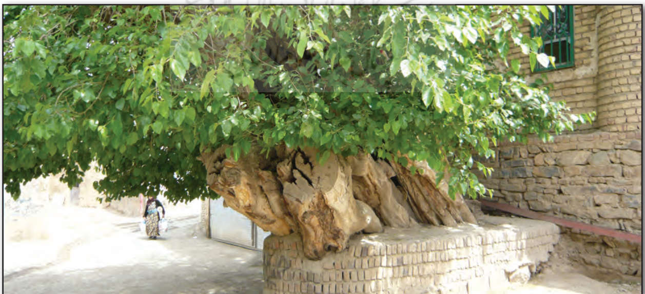
تصویر ۳: زیارتگاه نایسر (ناهیدسر) سنندج، درخت کهنسال، عکس: شهره جوادی، ۱۳۹۰.

تاریخ و در ادیان و باورهای مختلف بر آن تأکید شده است. از جمله رسوم مربوط به بزرگداشت آب و گیاه که با زندگی و سلامتی انسان‌ها پیوند داشته است. تقدس و احترام به طبیعت و مظاهر آن که در دین